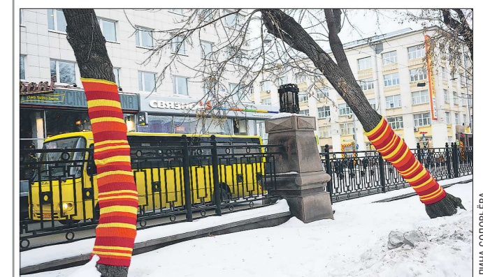
Оказывается, такие вязаные чехлы на деревьях могут быть полезны