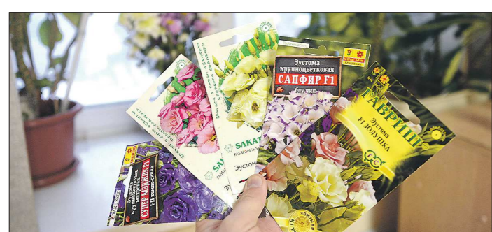
Лучше взять несколько сортов зустомы, чтобы получить разноцветную клумбу