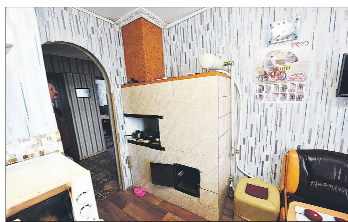
Печка снабжена отопительным котлом и экономит энергию