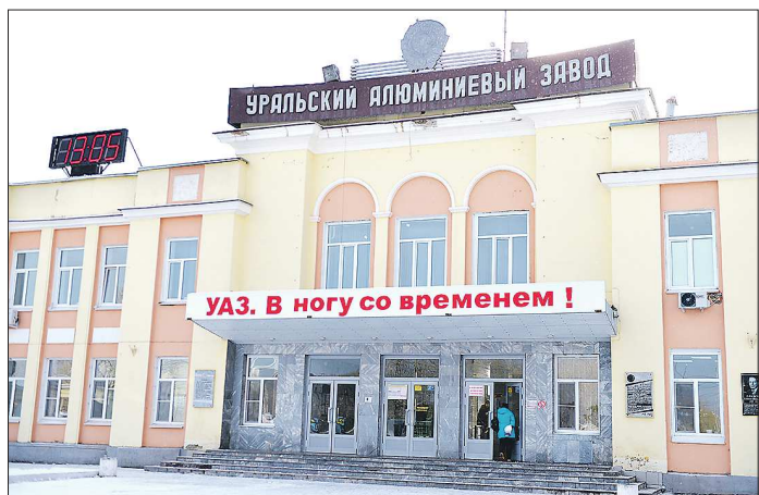
8 274 заводчанина УАЗа были награждены медалью за доблестный труд в период Великой Отечественной войны

Начало Великой Отечественной войны для советской цветной металлургии стало серьёзным потрясением – производство проката металлов упало в 430 раз. Как известно, металлы во многом являются настоящим скелетом войны, а кровью выступает нефть.