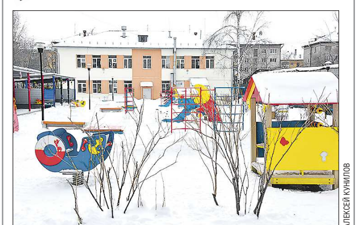
В администрации Белоярского ГО признают, что садик очень нужен селу