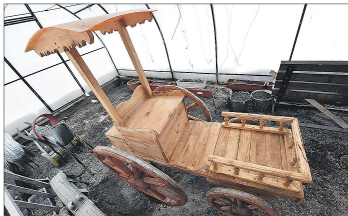
Карета получилась необычной: человеку на ней будет не совсем удобно, а вот цветам – в самый раз