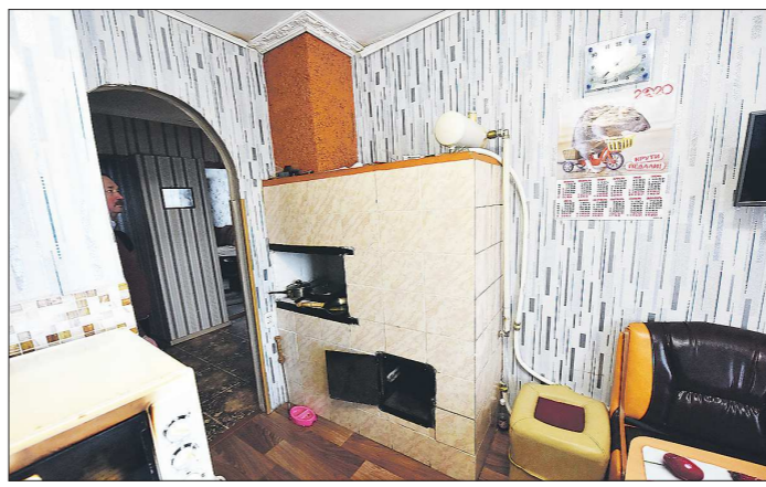
Печка снабжена отопительным котлом и экономит энергию