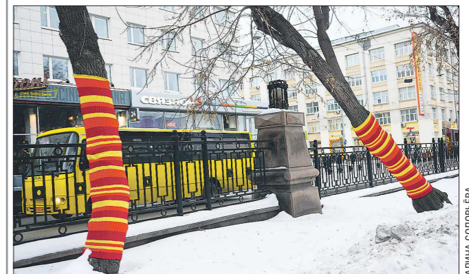
Оказывается, такие вязаные чехлы на деревьях могут быть полезны