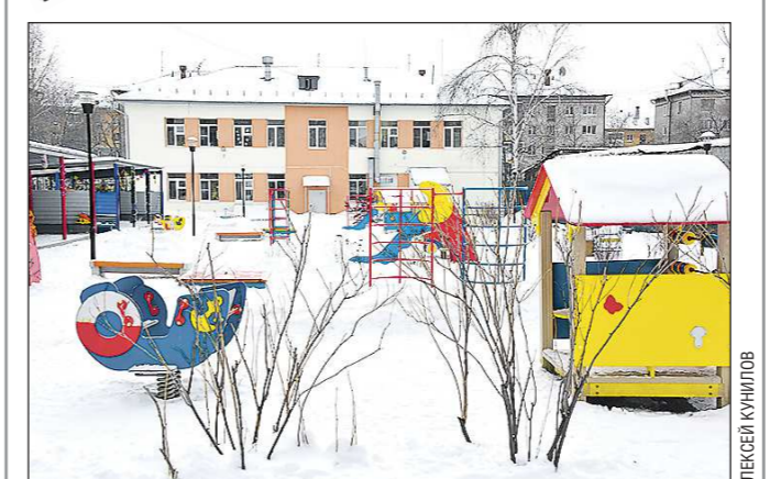
В администрации Белоярского ГО признают, что садик очень нужен селу