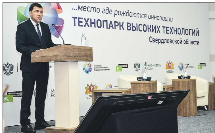
Евгений Куйвашев призвал представителей предприятий активнее включаться в реализацию национального проекта

Подготовлено в соответствии с критериями, утверждёнными приказом Департамента информационной политики Свердловской области от 09.01.2018 №1 «Об утверждении критериев отнесения информационных материалов, публикуемых государственными учреждениями Свердловской области, в отношении которых функции и полномочия уполномоченного органа осуществляет Департамент информационной политики Свердловской области, к социально значимой информации».