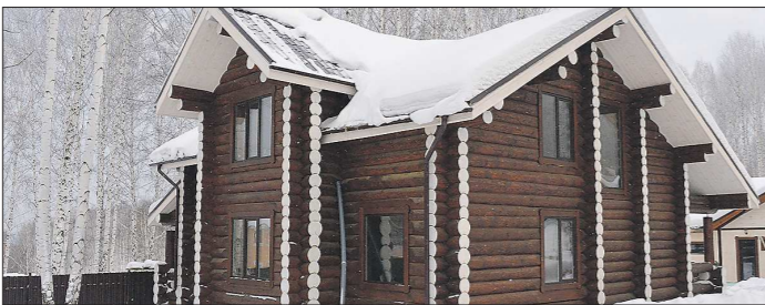
Переводить жилое помещение в нежилое для занятия гостиничным бизнесом теперь придётся обязательно

Вопрос читателя касается необходимости перевода помещения гостевого дома из жилого в нежилое в случае, если он будет продолжать заниматься гостиничным бизнесом. Кроме того, предприниматель интересуется, нужно ли будет в этом случае переводить на землю ИЖС в другую категорию.