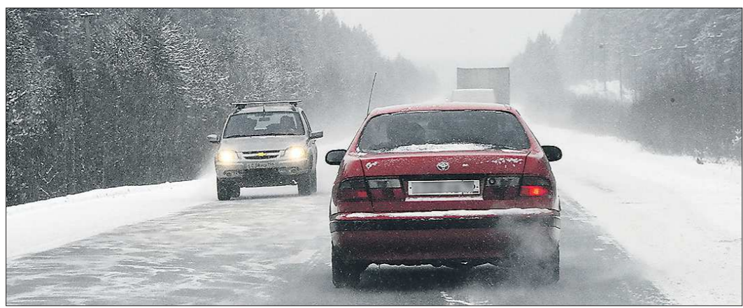
Право водить машину имеют не только глухие, но и слабослышащие люди. Однако дорожные условия на Среднем Урале очень часто бывают непростыми даже для абсолютно здоровых водителей

Подготовлено в соответствии с критериями, утвержденными приказом Департамента информационной политики Свердловской области от 09.01.2018 №1 «Об утверждении критериев отнесения информационных материалов, публикуемых государственными учреждениями Свердловской области, в отношении которых функции и полномочия учредителя осуществляет Департамент информационной политики Свердловской области, к социально значимой информации».