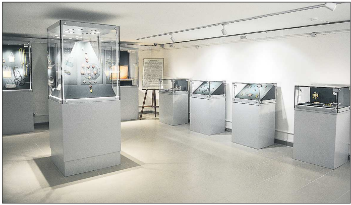
Так выглядит обновлённая Золотая кладовая

После долгого перерыва в екатеринбургском Музее истории камнерезного и ювелирного искусства открылась Золотая кладовая.