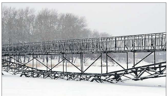
Многие семьи проживают на территории СНТ постоянно, так что по этому аварийному мосту в школу вынуждены ходить и дети