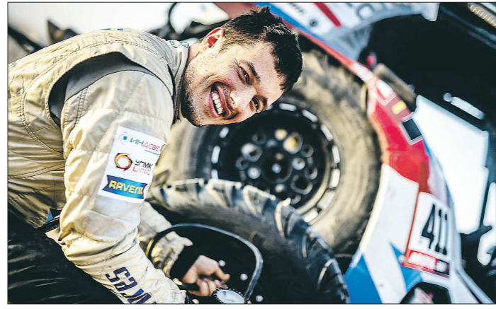
Сергей Карякин стал первым россиянином, который попал в число призёров «Дакара» в двух классах