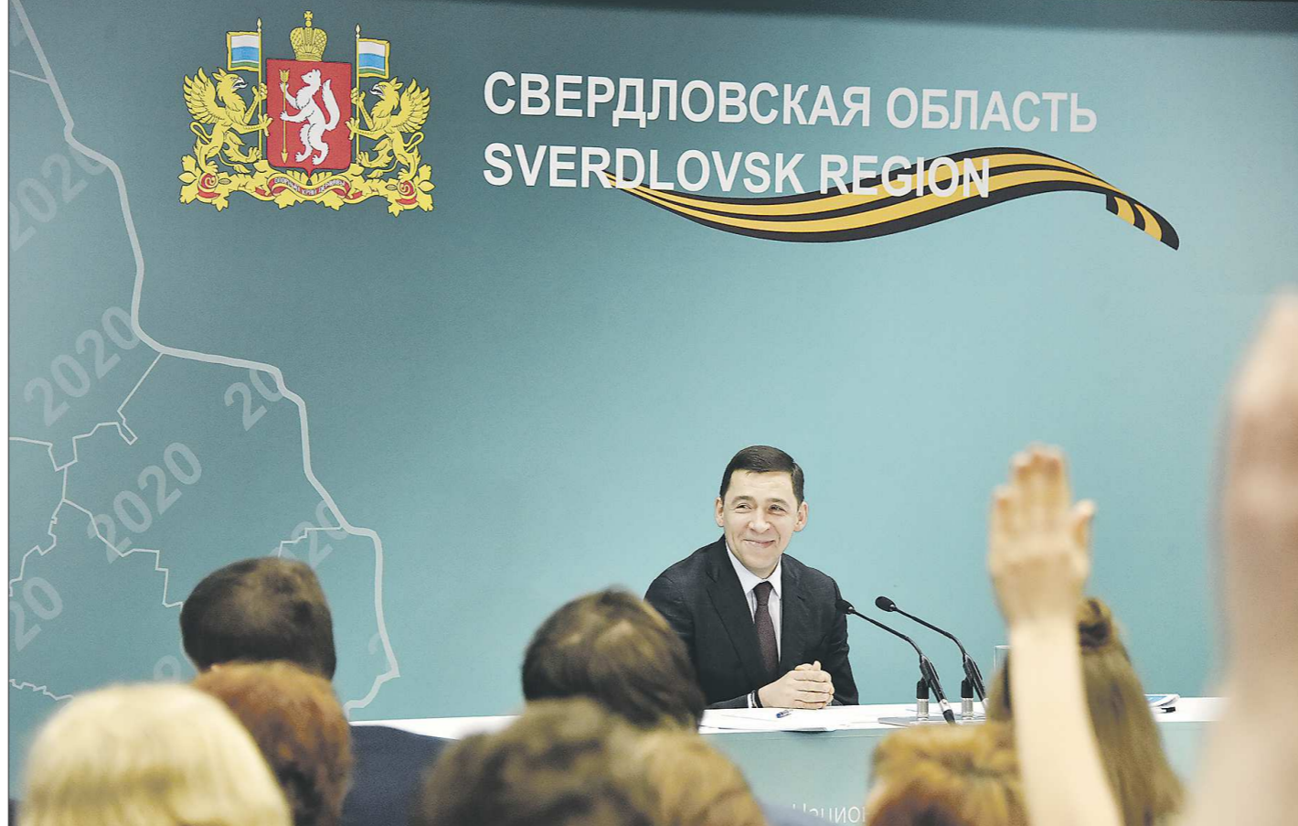
За год у журналистов накопилось много вопросов к губернатору. Поэтому большинство журналистов задавали сразу по два-три. Несмотря на то, что тайминг встречи был ограничен, Евгений Куйвашев предложил работать до последней поднятой руки

– Это гражданско-правовые отношения. Если будет меняться генплан, то нужно начать диалог через депутатов городской и областной