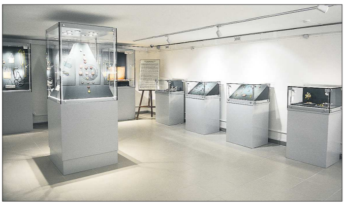
Так выглядит обновлённая Золотая кладовая

После долгого перерыва в екатеринбургском Музее истории камнерезного и ювелирного искусства открылась Золотая кладовая. Одним из первых в ней побывали журналисты «Областной газеты».