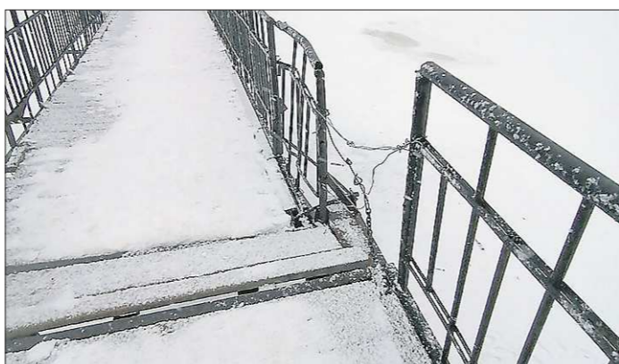
Ходить по разрушающемуся мосту опасно, а зимой ещё сложно и скользко