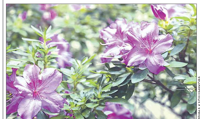
При комфортной температуре азалия может цвести несколько недель, постепенно раскрывая бутоны