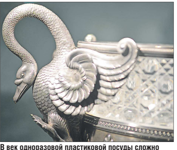
В век одноразовой пластиковой посуды сложно представить, что кухонная утварь может быть настоящим произведением искусства