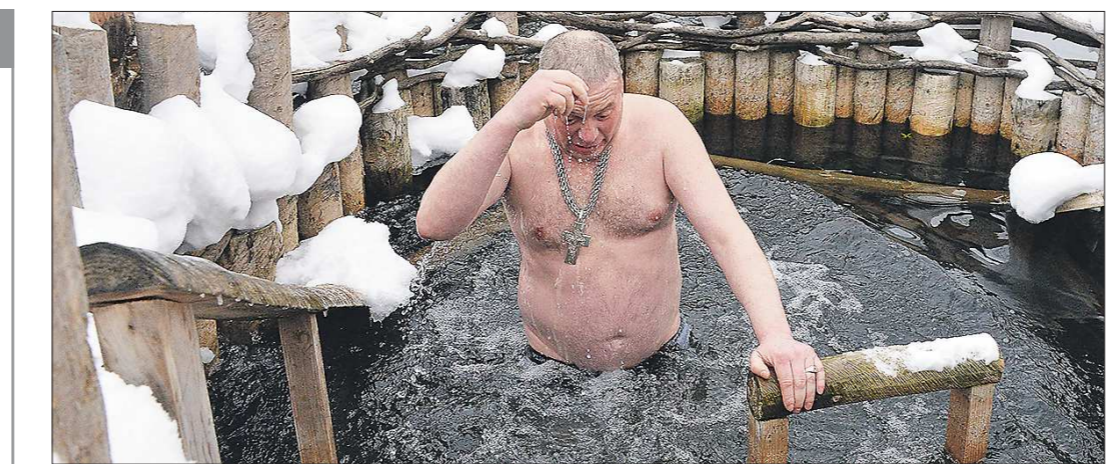
К купанию в Крещение лучше подготовиться заранее, закаляясь. Помните, что заходить в холодную воду нужно постепенно