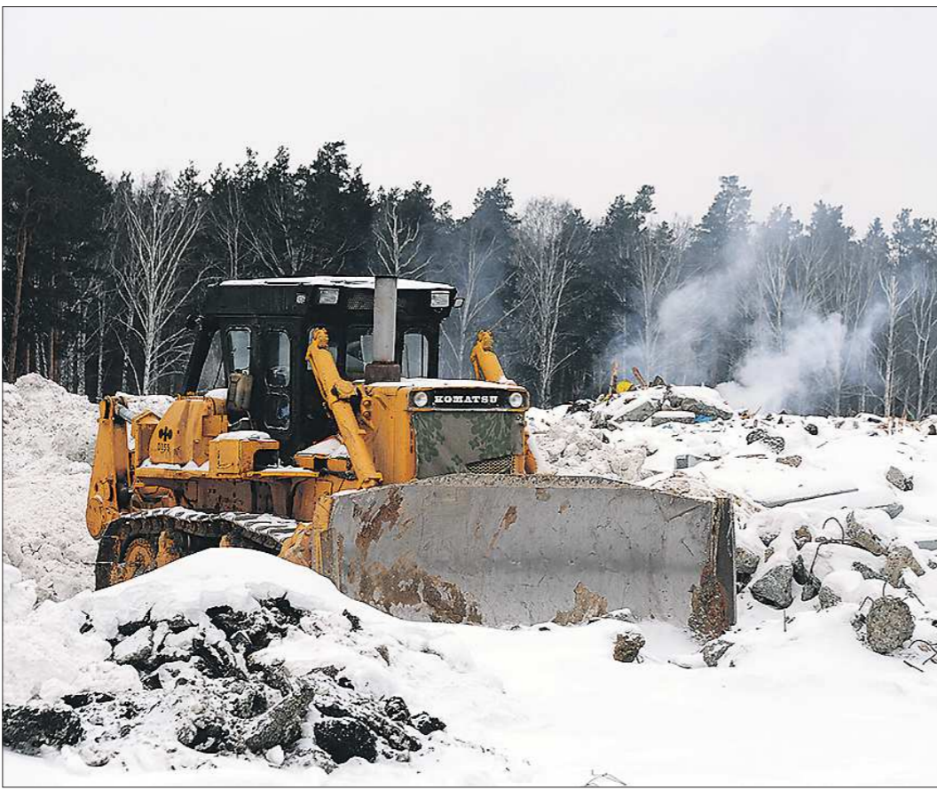
Снег поверх отходов равняют грейдером