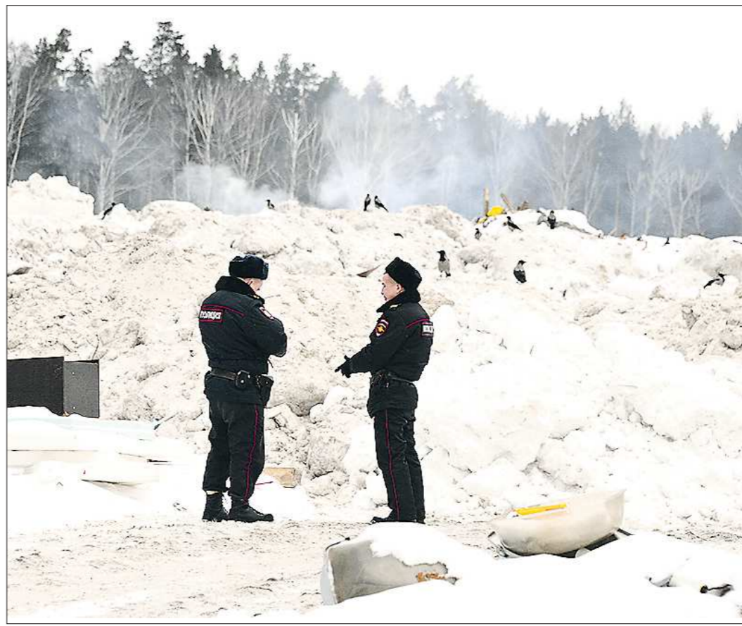
Сотрудники полиции дежурят у свалки круглосуточно