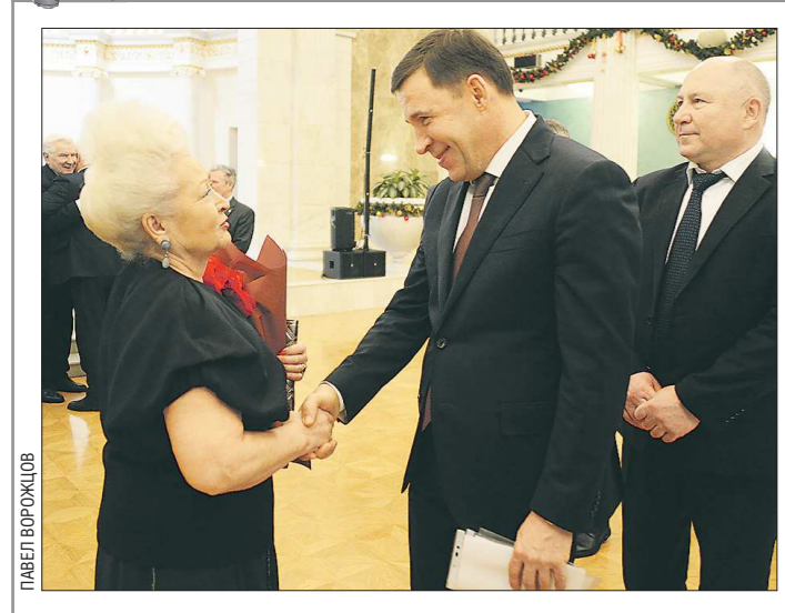
Вчера в Екатеринбурге в Доме Севастьянова губернатор Свердловской области Евгений Куйвашев провёл торжественный приём почётных граждан Свердловской области и муниципалитетов региона...