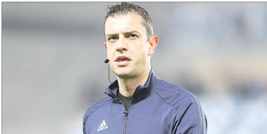
Виктор Кашшаи: «Уверен, что благодаря совместной работе мы сможем вывести судейство в России на принципиально новый уровень»

В российском футболе новое лицо: руководителем департамента судейства стал венгерский специалист Виктор Кашшаи, сменив на этом посту Александра Егорова. В Российском футбольном союзе (РФС) уверены: Кашшаи сможет донести до наших арбитров самые современные тенденции и практики судейства.