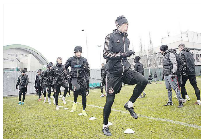
«Урал» начал подготовку к весенней части сезона