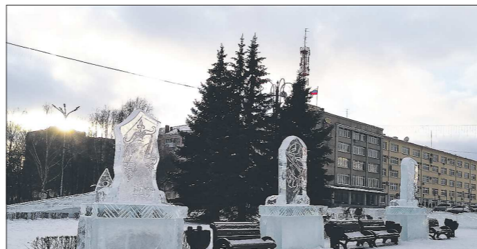
В ранних сумерках скульптуры вызывают у тагильчан готический восторг

В потоке радостных откликов уральцев в соцсетях о проведённых каникулах нередко можно встретить жалобы на укатанные до асфальта скакаты. На таких «пешеходных» катюшках удалось покататься детям Берёзовского и Верхней Салды.