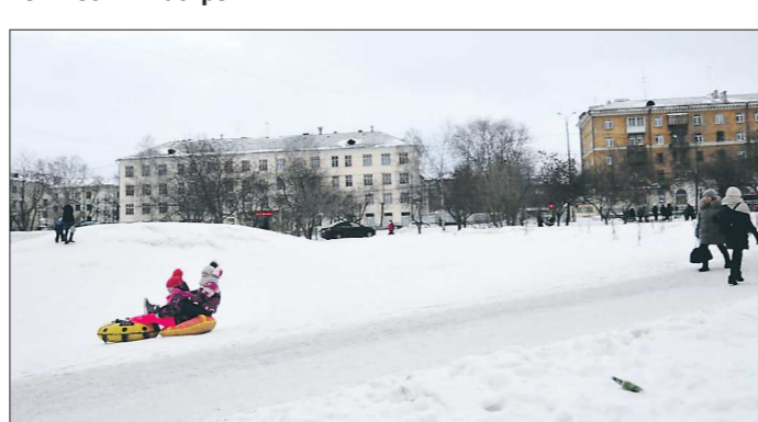
Вот такая стихийная горка возникла у ДК Лаврова в Екатеринбурге. Дети скатываются практически под ноги прохожим

В этом году был посвящён теме «Космос. Незнайка на Луне». На тендер зашли два участника, которые по условиям тендера должны были предоставить эскизы по заявленной теме.