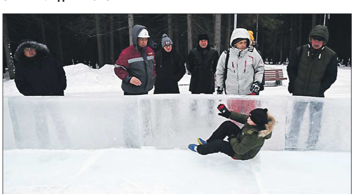
На приёме городка в Ревде комиссия увидела, как катающиеся врезаются в ледяной борттик. Опасную горку пришлось закрыть на несколько дней для ремонта