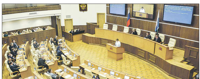
На пленарных заседаниях областного парламента высокую активность проявляют представители всех четырёх его фракций