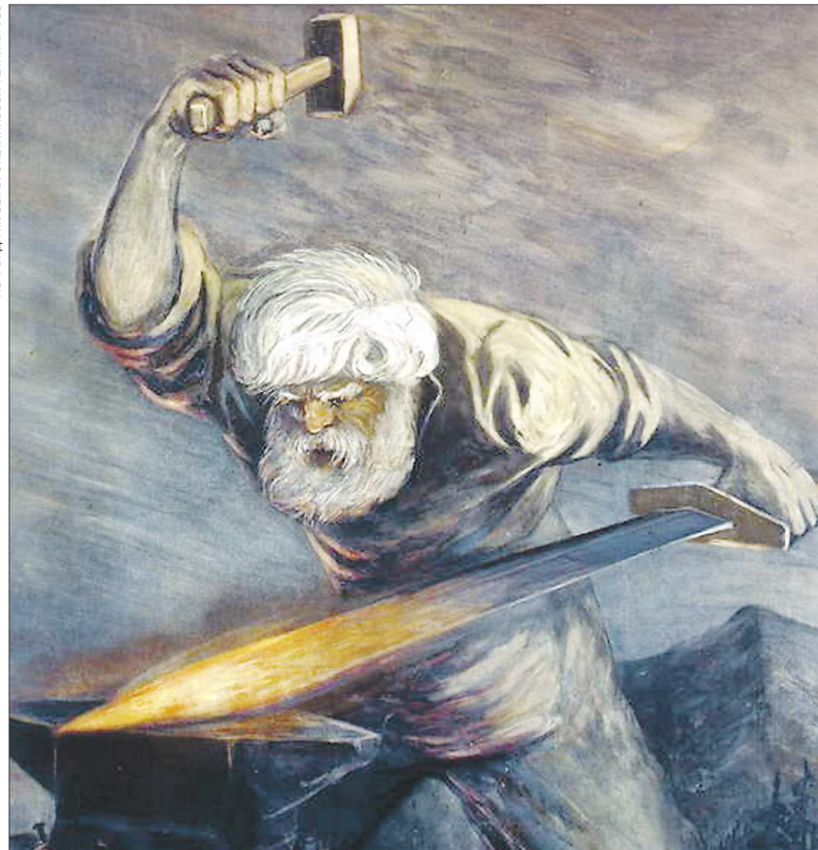
«Седой Урал куёт Победу», И. Воскобойников, 1944 г.