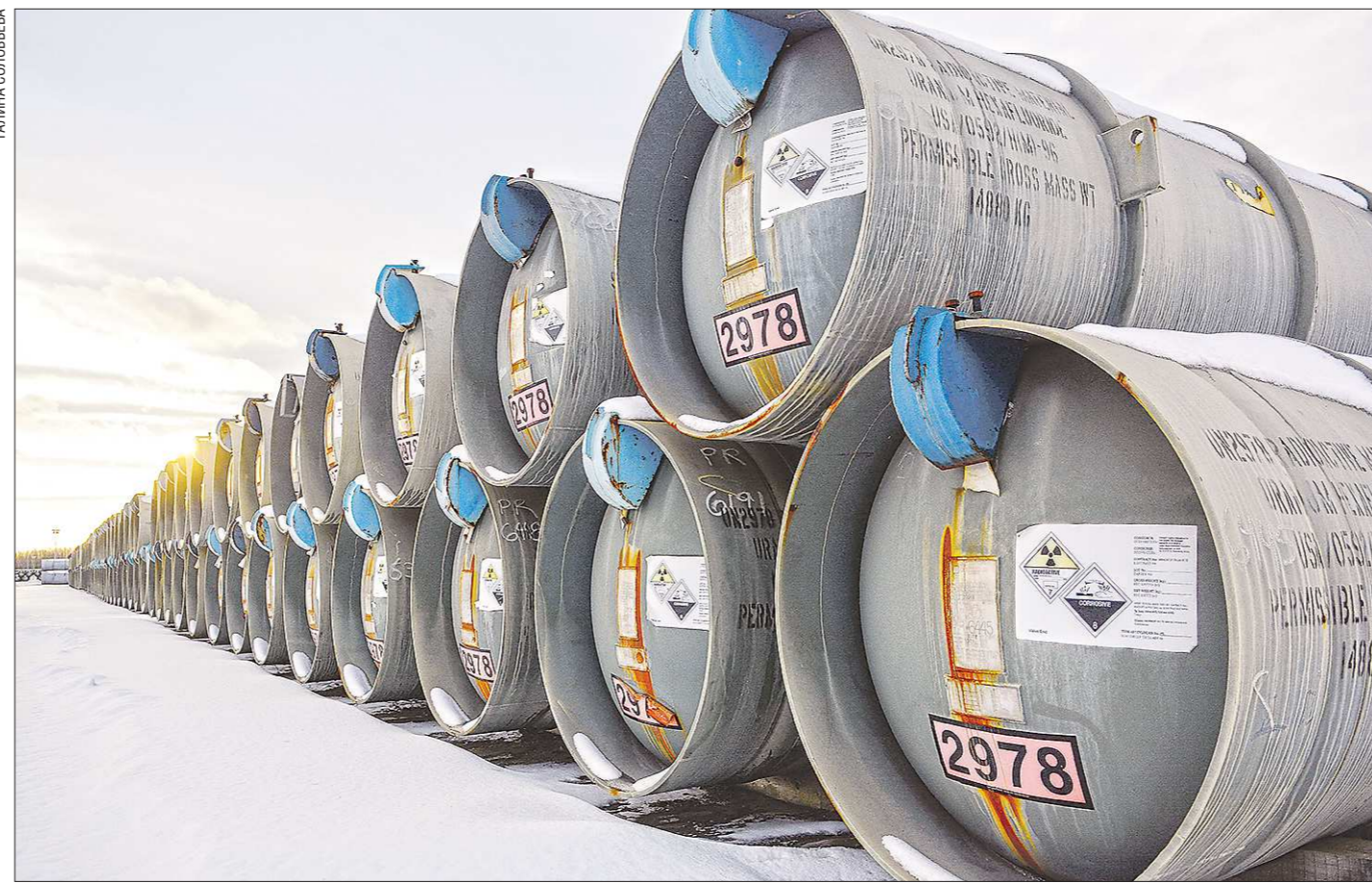
Контейнеры, в которых транспортируется и хранится обеднённый уран, изготовлены из углеродистой стали, толщина стенок - 13-15 мм. В соответствии со стандартами МАГАТЭ, предусмотрена защита при нагревании до 800°C. Разрушить такую защиту переносимыми средствами невозможно

Зачем в Новоуральск везут обеднённый уран из Европы?