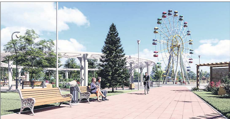
Вот таким по проекту станет парк культуры и отдыха в Богдановиче. В воскресенье горожан ждут в администрации, чтобы обсудить проект