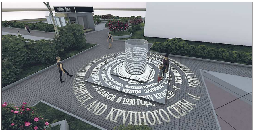
Один из арт-объектов, которые предлагают установить в Красноуфимске – металлический столб с иллюминацией

До конца января в Москве принимают заявки на конкурс лучших проектов создания комфортной городской среды в малых городах и исторических поселениях.