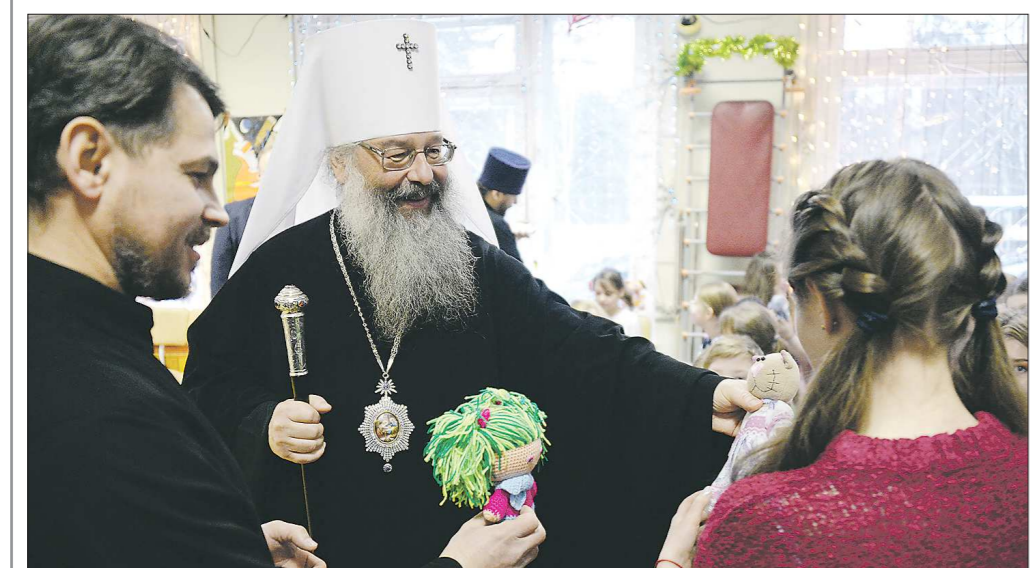
Вчера митрополит Екатеринбургский и Верхотурский Кирилл поздравил пациентов детского отделения Свердловского областного противотуберкулёзного диспансера с Рождеством. Певчие Успенского собора Екатеринбургского спели для маленьких пациентов диспансера Рождественские колядки. Ребятам вручили игрушки, которые изготовили участники благотворительного проекта «От сердца к сердцу»

Подготовлено в соответствии с критериями, утверждёнными приказом Департамента информационной политики Свердловской области от 09.01.2018 №1 «Об утверждении критериев отнесения информационных материалов, публикуемых государственными учреждениями Свердловской области, в отношении которых функции и полномочия учредителя осуществляет Департамент информационной политики Свердловской области, к социально значимой информации».