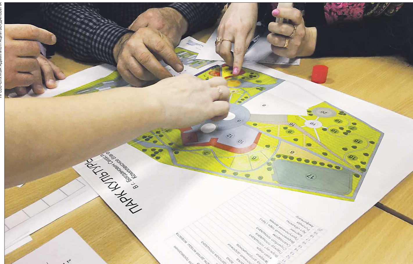
Общий бюджет проекта благоустройства парка культуры и отдыха в Богдановиче составляет 223 миллиона рублей

До конца января принимаются заявки лучших проектов благоустройства городской среды