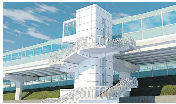
Для безопасного перехода через ж/д пути сделают тротуар с лестничными сходами

Учитывая, что вблизи развязки — много жилых домов и инженерных сетей, «Областзета» сделала вывод: администрации города, скорее всего, придется изымать часть земельных участков под строительство, и начать делать это уже со следующего года.