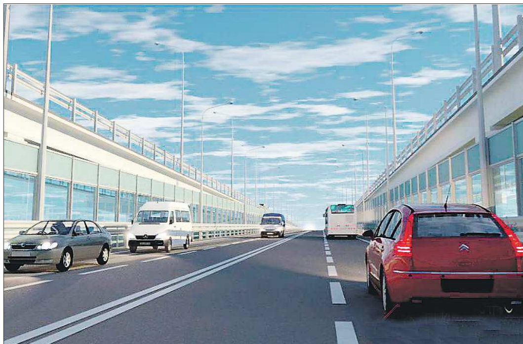
Так по проекту будут выглядеть проезды новой эстакады

Администрация Екатеринбурга завершила общественные обсуждения по проектам планировки и межевания территории вокруг транспортной развязки у концерна «Калина»