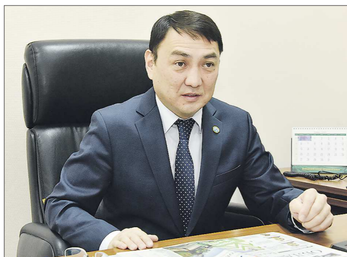
Руслан Бибиосунув занимает должность генконсула с сентября 2019 года

Наступивший 2020 год объявлен Перекрестным годом Кыргызстана в России и России в Кыргызстане. Республика — давний партнер Свердловской области.