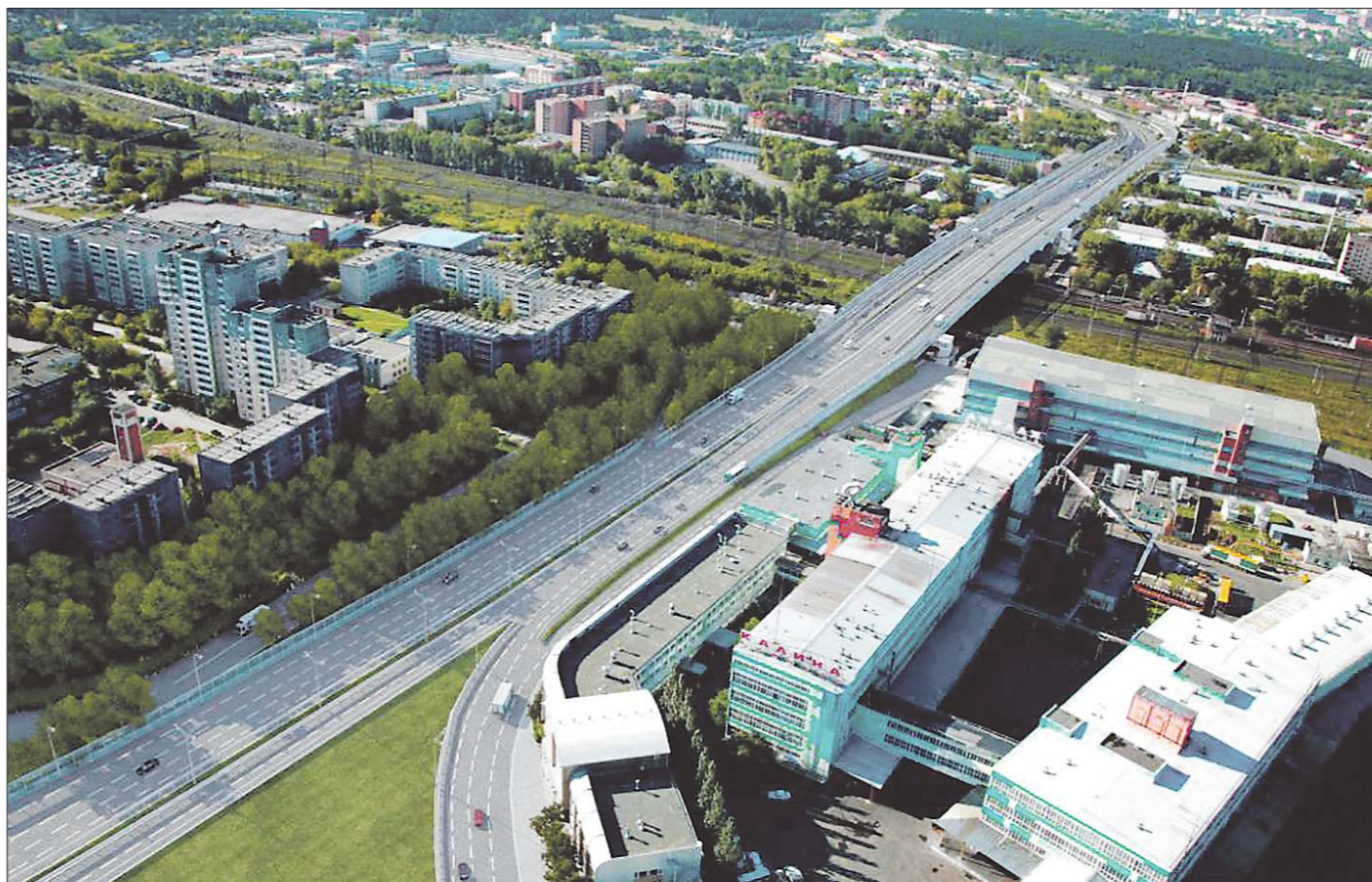
Так по замыслу проектировщиков будет выглядеть развязка после реконструкции

«Областная газета» узнала подробности о реконструкции транспортного узла у «Калины»