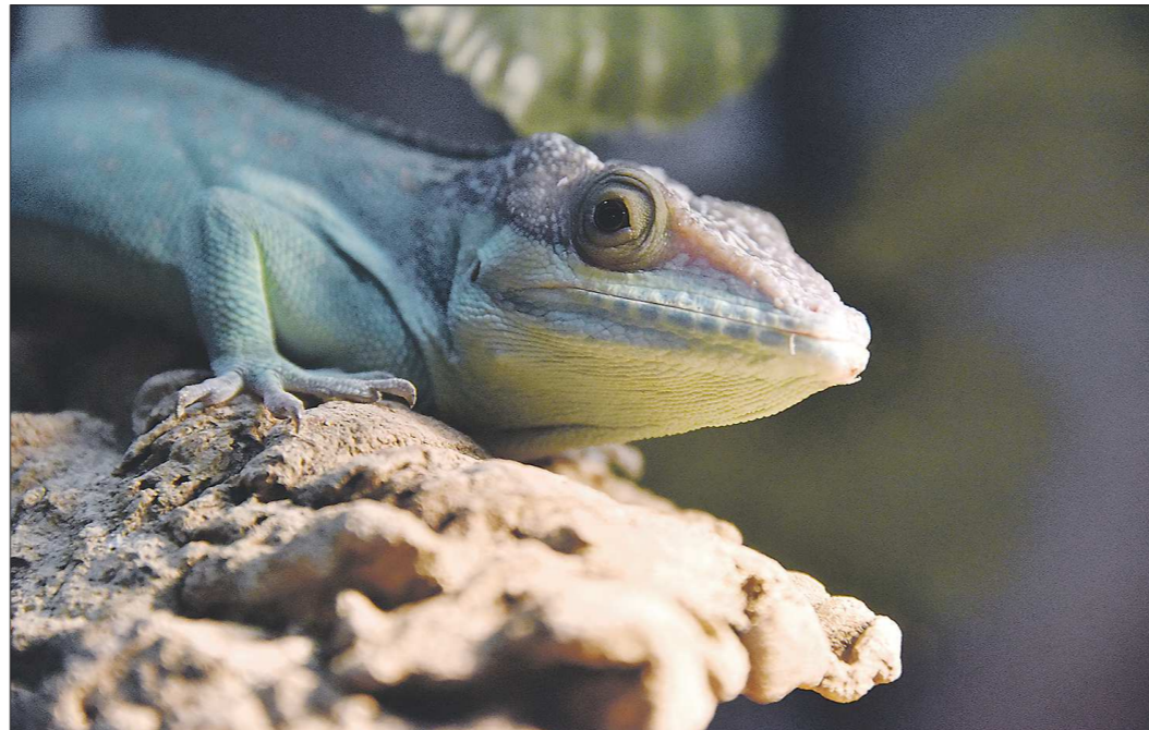
С этого года начала действовать норма, которая запрещает держать дома экзотических животных – их список утверждён федеральным правительством

В-третьих, с 1 января в России вне закона оказались контактные зоопарки. Мероприятия, где посетители могут контактировать с живот-