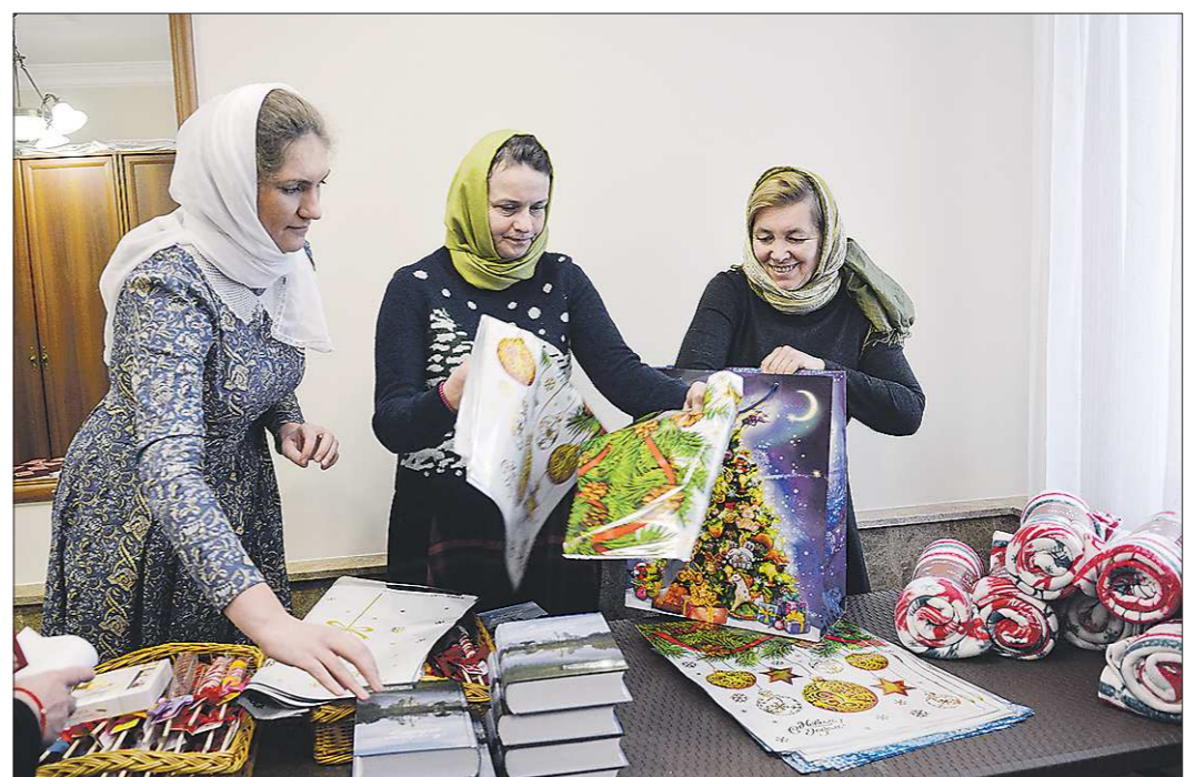
В подарочные наборы для детей, которые готовят в Ново-Тихвинском монастыре в Екатеринбурге, непременно входят сладости