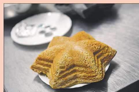
взбитые белки. На последнем этапе добавить сок и йогурт. Готовое тесто похоже на мягкий текучий мёд. Перед запеканием добавить одну или несколько монеток, завернутых в фольгу.

Ингредиенты: яйцо – 4 штуки мука – 350 г маргарин – 100 г разрыхлитель копьяк – 1 чайная ложка апельсиновый сок – 100 мл йогурт – 80 г оливковое масло – 1 столовая ложка подсолнечное масло – 1 столовая ложка ванилин – 1 г сахар – 2/3 стакана цедра апельсина – 1 чайная ложка