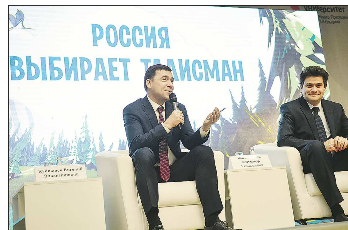
По словам Евгения Куйвашева, свой вариант талисмана у него есть, но он расскажет о нём позднее, чтобы его мнение не выглядело «истиной в последней инстанции»

«До Универсиады осталось, если память мне не изменяет, 1322 дня», – отметил на посвящённом этому событию пресс-конференции губернатор Свердловской области Евгений Куйвашев. – Мы сегодня даём старт очень важ-