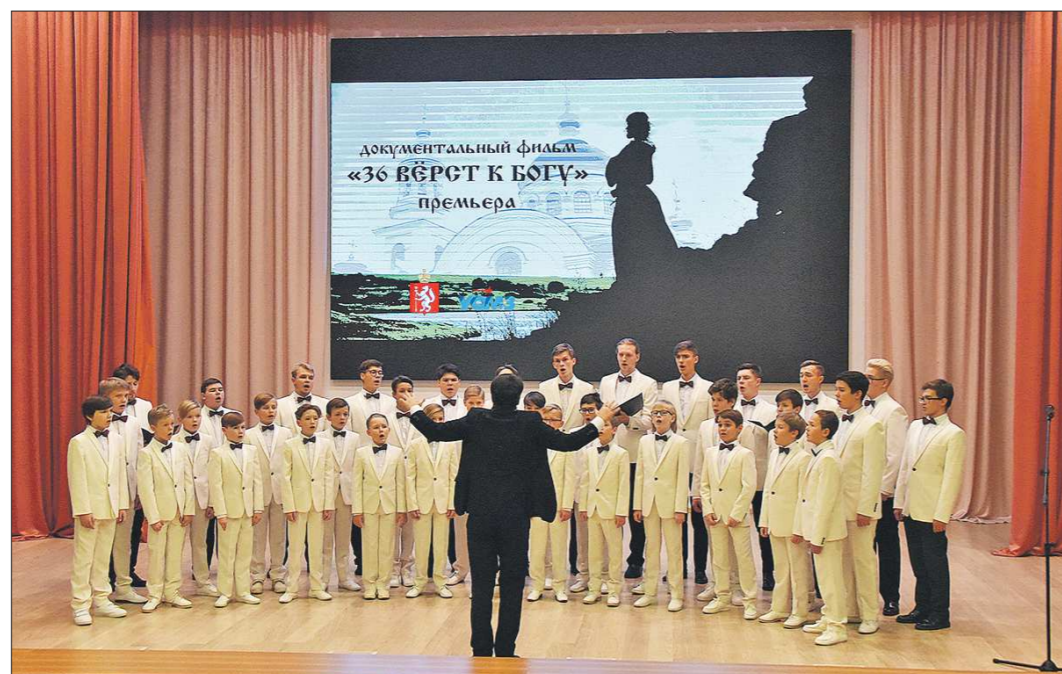
На премьеру документального фильма «36 вёрст к Богу» выступил хор Свердловской государственной детской филармонии

— Мы постарались снять документально-постановочное кино с реконструкцией того времени и событий, — рассказывает генеральный продюсер фильма, заслу-