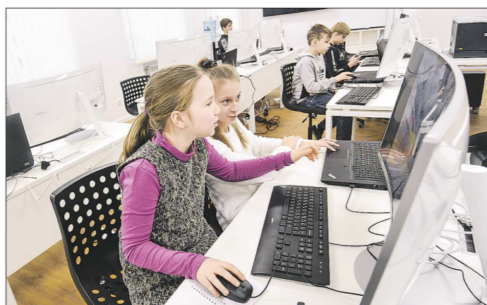
Сегодня Екатеринбург по качеству IT-образования входит в тройку российских лидеров наравне с Москвой и Санкт-Петербургом. «IT-куба» позволит удерживать это лидерское положение

Здесь, на базе Роботдрома Дворца молодёжи, что на Эльмаше, двери для детей открыли сразу шесть лабораторий. Они оборудованы самой современной в уральской столице техникой для обучения школьников – подобной нет ни в одном коммерческом центре или государственной школе на Среднем Урале. Ребята по специально разработанной для них программе изучают киберигру, обработку больших данных и нейросети – самые современные направления информационных технологий.