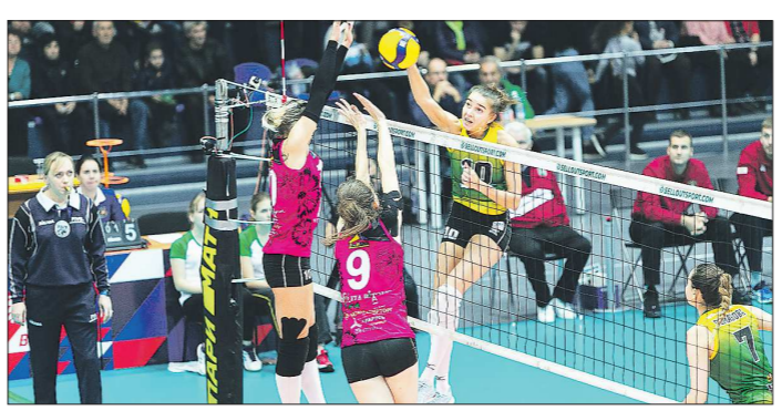
«Уралочка» не знает поражений в последних пяти матчах

Данил ПАЛИВОВА Подготовлено в соответствии с критериями, утверждёнными приказом Департамента информационной политики Свердловской области от 09.01.2018 №1 «Об утверждении критериев отнесения информационных материалов, публикуемых государственными учреждениями Свердловской области, в отношении которых функции и полномочия учредителя осуществляет Департамент информационной политики Свердловской области, к социально значимой информации».