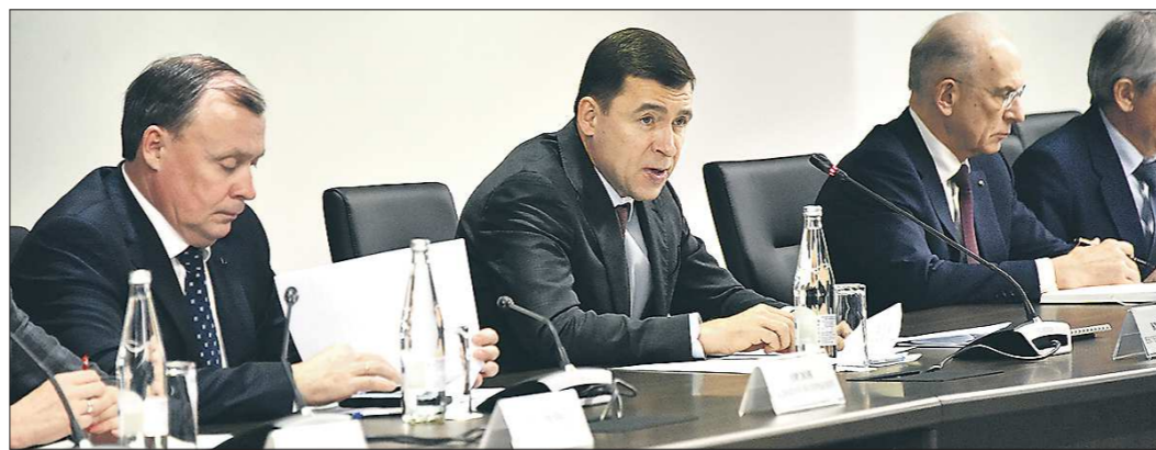
Губернатор Евгений Куйвашев (в центре) отметил, что в 2019 году 32 муниципалитета повысили свою инвестиционную привлекательность

Муниципалитетам - лидерам рейтинга инвестиционной привлекательности будут выделяться дополнительные средства в размере 150 млн рублей.