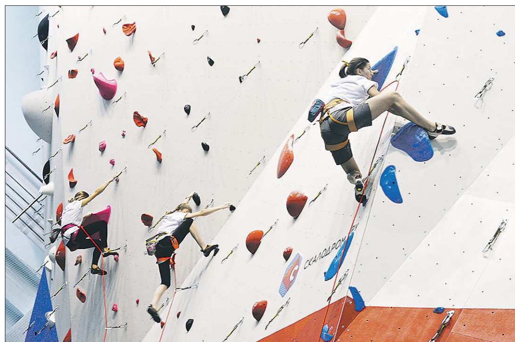
Новый скалодром - сложное сооружение: только монтажные работы обошлись в несколько миллионов рублей