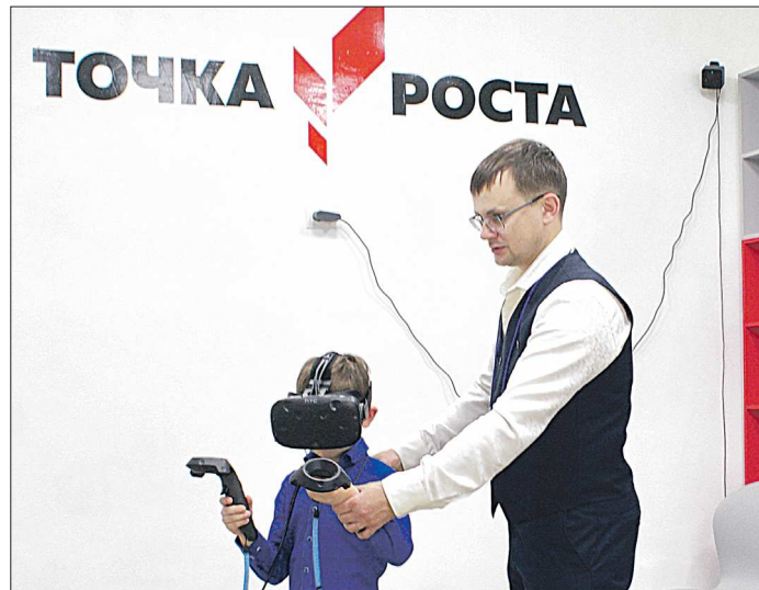
В этом году на приобретение средств обучения для создания центров «Точка роста» в Свердловской области предусмотрено 148,8 миллиона рублей