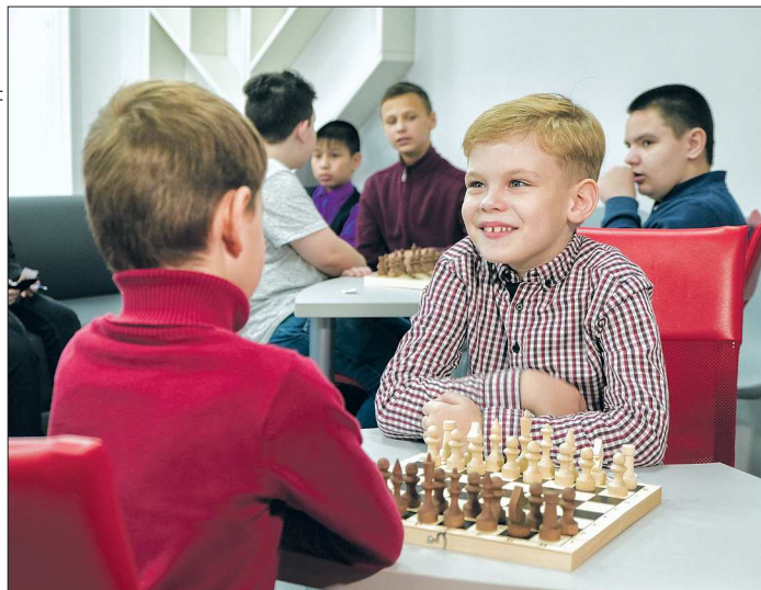
В этом году на приобретение средств обучения для создания центров «Точка роста» в Свердловской области предусмотрено 148,8 миллиона рублей

Подготовлено в соответствии с критериями, утверждёнными приказом Департамента информационной политики Свердловской области от 09.01.2018 №1 «Об утверждении критериев отнесения информационных материалов, публикуемых государственными учреждениями Свердловской области, в отношении которых функции и полномочия учредителя осуществляет Департамент информационной политики Свердловской области, к социально значимой информации».