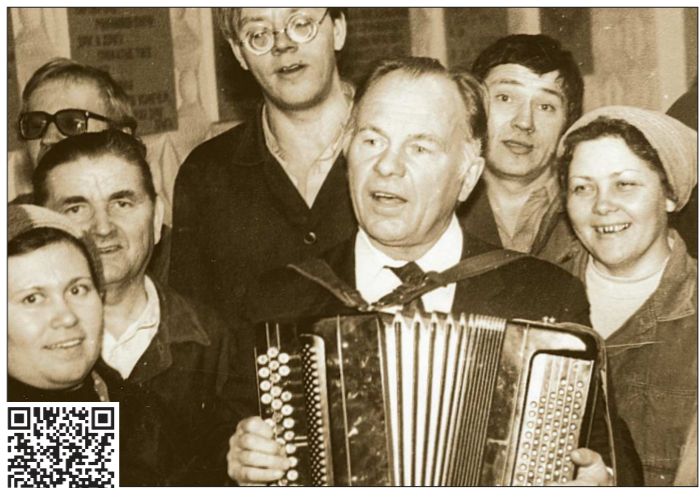
«Персона» – на сайте «ОГ» oblgazeta.ru