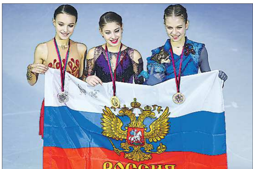
Российский пьедестал: Алёна Косторная (золото), Анна Щербакова (серебро), Александра Трусова (бронза)