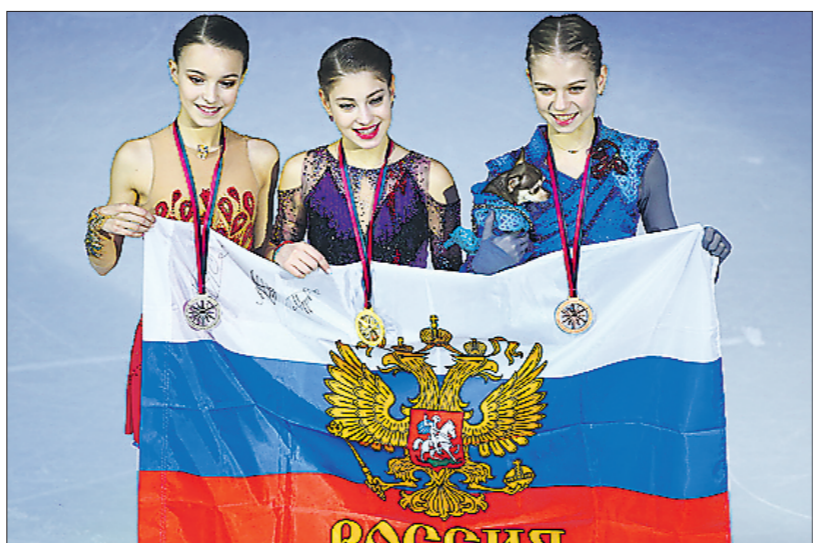
Российский пьедестал: Алёна Косторная (золото), Анна Щербакова (серебро), Александра Трусова (бронза)