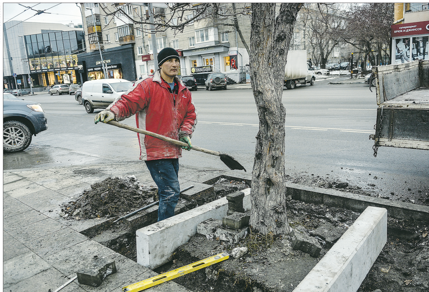
Этот снимок был сделан на улице Малышева вчера днём

Почему ремонт тротуаров в Екатеринбурге затянулся на полгода?