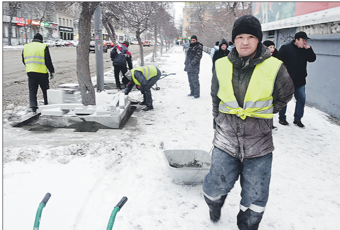
В минувшее воскресенье ремонт должен был быть закончен – на этот раз уже точно. Однако что-то снова пошло не так