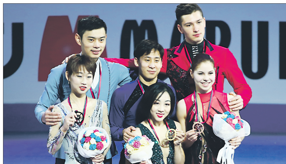
У спортивных пар первые два места остались за китайцами – золоту у Вэньцзинь Суй – Цун Хань , серебро завоевали Ченг Пенг и Янг Джин . Бронза – у россиянок Анастасии Мишиной и Александра Галлямова

Подготовлено в соответствии с критериями, утвержденными приказом Департамента информационной политики Свердловской области от 09.01.2018 №1 «Об утверждении критериев отнесения информационных материалов, публикуемых государственными учреждениями Свердловской области, в отношении которых функция и полномочия уполномоченного осуществляет Департамент информационной политики Свердловской области, к социально значимой информации».