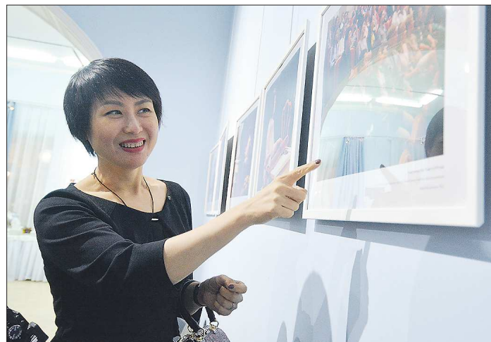
Многие снимки на выставке вызывают у посетителей неподдельный интерес