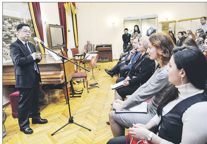
Господин Ши Тяньцзя рассказывает о том, как развивались взаимоотношения между двумя странами в этом году

В Екатеринбурге открылась международная фотовыставка «Китай и Россия – годы межрегионального сотрудничества», приуроченная к 70-й годовщине установления дипломатических отношений между двумя странами. На ней представлено более 100 фотографий, на которых запечатлены не только знаковые дипломатические визиты делегаций наших государств, но и будни и праздники Китая и Урала. Экспозицию можно посетить до 19 января в Свердловском областном краеведческом музее имени О. Е. Клера.