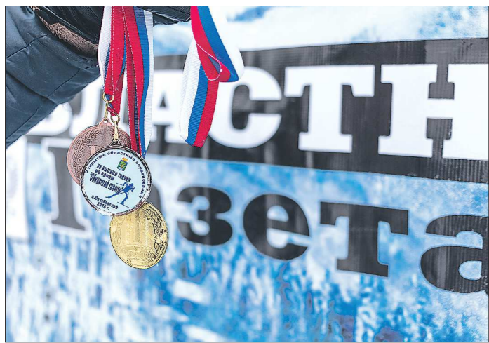
Почти четверть века с лыжных гонок «ОГ» начинается на Среднем Урале лыжный сезон