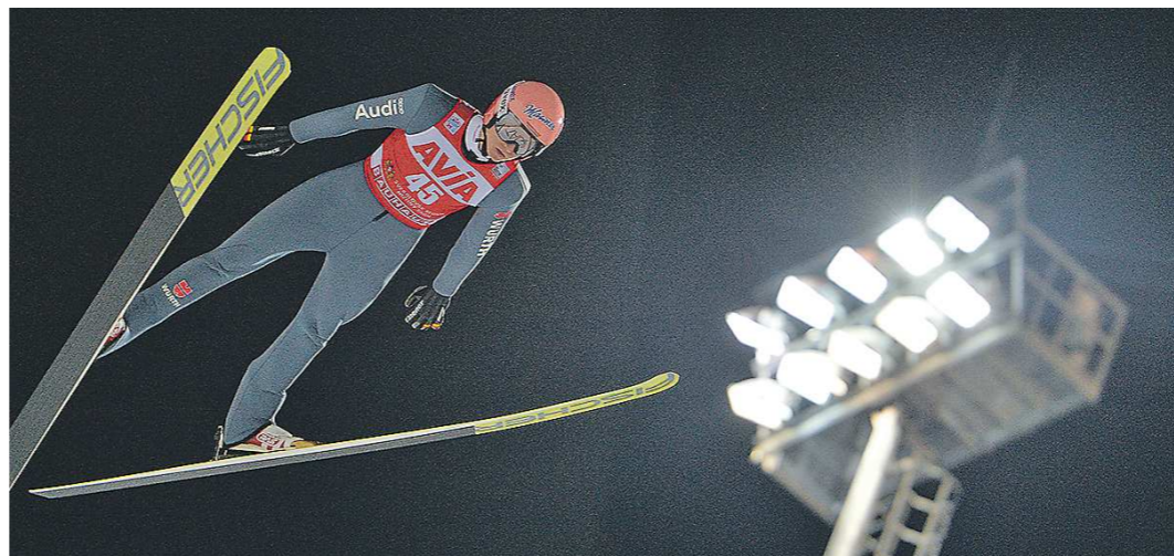
Прыжки на лыжах с трамплина - очень зрелищный вид спорта. Смотреть его лучше живую

Сегодня, 6 декабря, в Нижнем Тагиле, на горе Долгой, начинаются соревнования лучшие летающие лыжники планеты. Средний Урал вновь принимает Кубок мира по прыжкам на лыжах с трамплина среди мужчин. В Тагиле придут спортсмены из 15 стран.