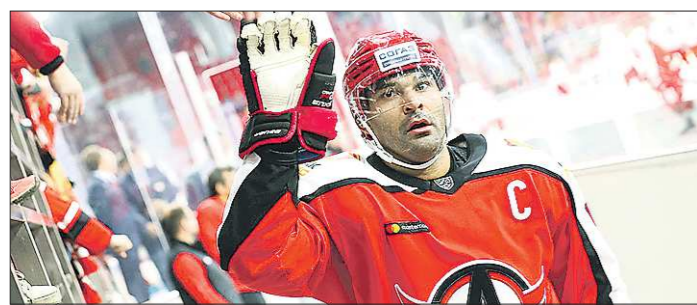
Найджел Доус пока единственный игрок «Автомобилиста» на Матче всех звезд КХЛ

Подготовлено в соответствии с критериями, утвержденными приказом Департамента информационной политики Свердловской области от 09.01.2018 №1 «Об утверждении критериев отнесения информационных материалов, публикуемых государственными учреждениями Свердловской области, в отношении которых функции и полномочия учредителя осуществляет Департамент информационной политики Свердловской области, к социально значимой информации».