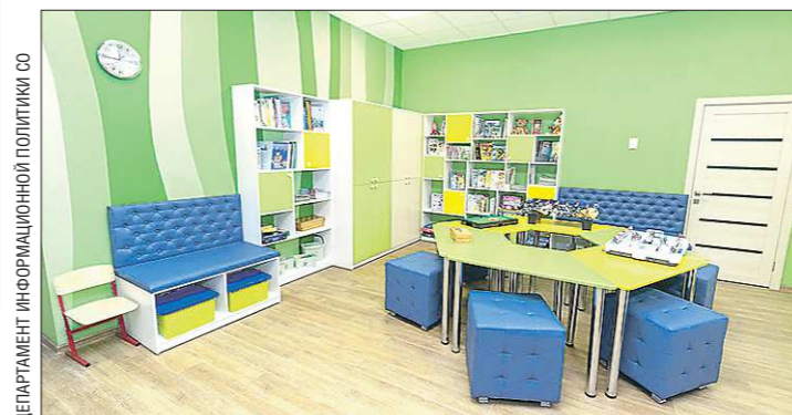
Дети в библиотеке теперь могут отдыхать, заниматься, читать, играть в настольные игры

сто можно сесть в тихую зону, спокойно почитать. Сейчас появились зоны отдыха, уединение для детей и для взрослых. Главным в библиотеке остаются книги, но теперь можно не только читать, но и смотреть, слушать, общаться, работать, творить и мечтать.