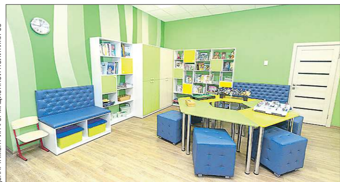
Дети в библиотеке теперь могут отдыхать, заниматься, читать, играть в настольные игры

сто можно сесть в тихую зону, спокойно почитать. Сейчас появились зоны отдыха, уединение для детей и для взрослых. Главным в библиотеке остаются книги, но теперь можно не только читать, но и смотреть, слушать, общаться, работать, творить и мечтать.