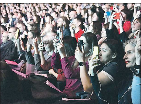
То и дело слушатели доставали смартфоны, чтобы сфотографировать слайды с советами от экспертов