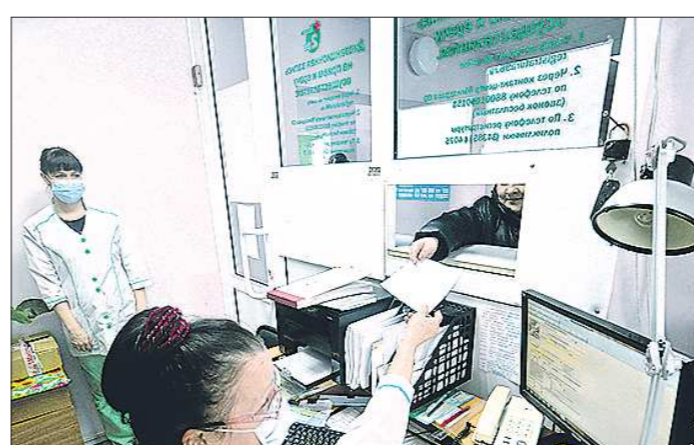
По словам жителей, медики, оставившие работать в Колчедане, получают максимум 0,5 ставки