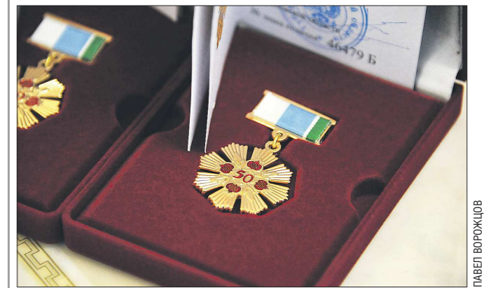
Пары выйдут до золотой свадьбы и дальше не ради наград, но и награду получить всегда приятно

Знак отличия «Совет да любовь» вручается в Свердловской области с 2011 года тем парам, кто прожил в крепком официальном браке 50 и более лет. В 2019 году этим знаком отметили 3 042 супружеские пары. Всего этой награды удостоены 46 216 пар в регионе. К награждённому знаку прилагается единовременная денежная выплата в размере пяти тысяч рублей каждому из супругов. Но, как сообщили «Облазете» в министерстве социальной политики Свердловской области, размер выплат не изменяется. В 2020 году в бюджете области на эти выплаты предусмотрено 28,7 млн рублей. Это больше чем на 1 млн рублей превышает сумму текущего года, но только потому, что в следующем году будет больше семейных пар, которые награждаются знаком «Совет да любовь». Никаких дополнительных выплат тем парам, которые уже отмечены этим знаком отличия, не вводят.