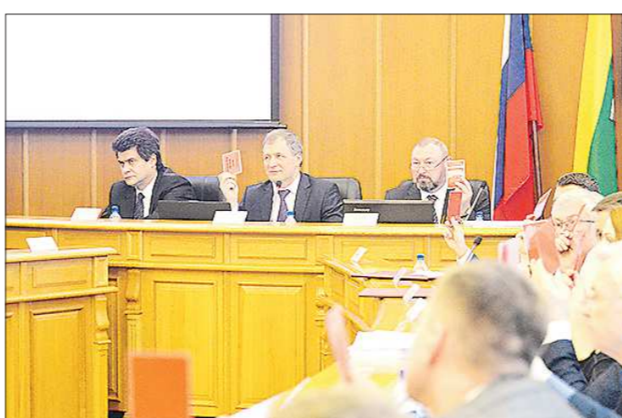
На заседании думы за выделение Академического в отдельный район проголосовали 33 депутата из 34