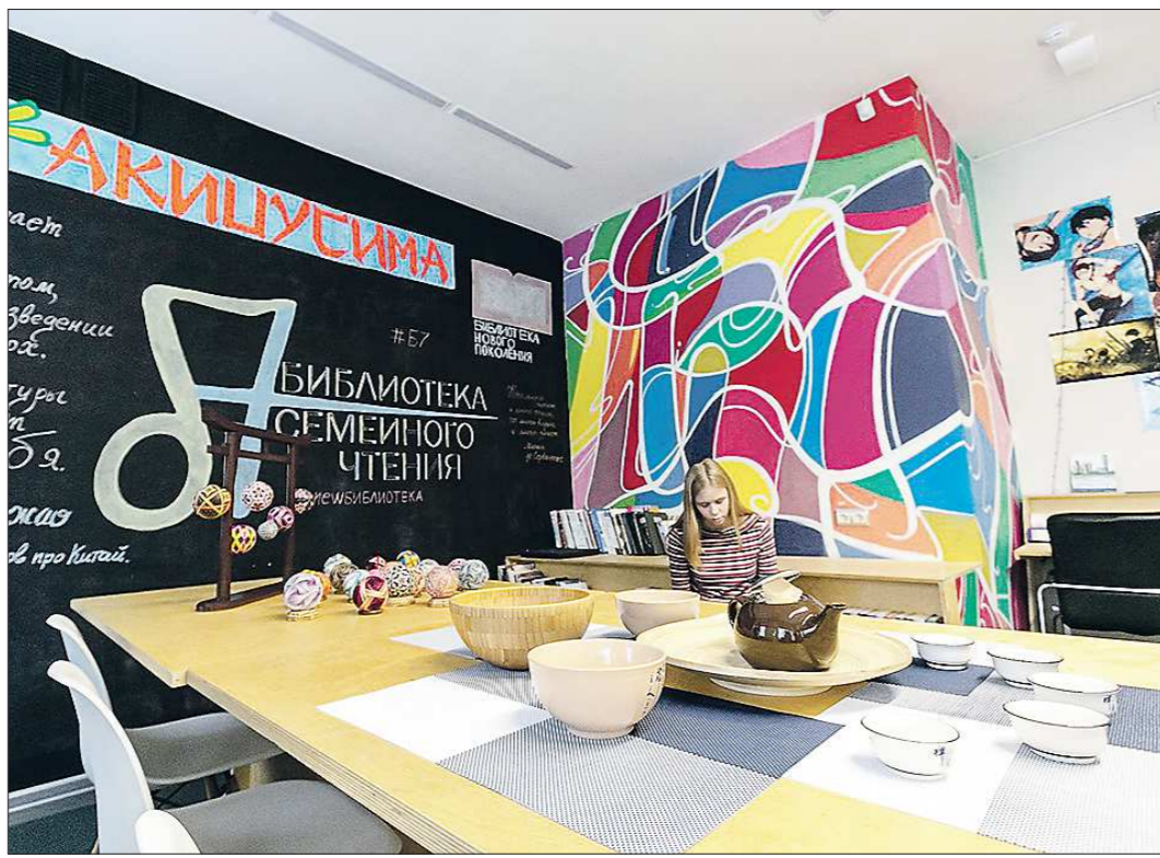
Обновлённая «Библиотека семейного чтения» со 2 декабря открыла свои двери для читателей

По замыслу, по той концепции, которая была заложена – это совершенно новый формат, благодаря которому мы видим не только традиционную библиотеку, к которой все привыкли, но и центр ком-