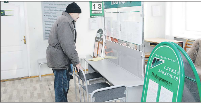
Выйти раньше срока на пенсию безработные предпенсионеры могут, если исчерпали все возможности по трудоустройству