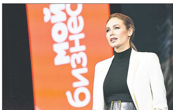
Ляйсан Утяшева выступила перед участниками с мотивационной лекцией о том, как не сдаться и как найти баланс между бизнесом и семьёй