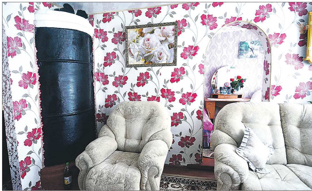
Эта голландка обогревает четыре комнаты!

Русская печь (23.11.2019) / Голландка / Очаг / Болгарская печь / Комбинированная печь