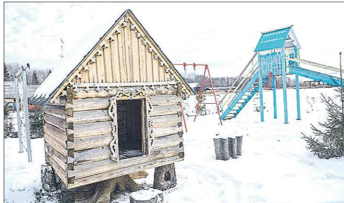
Для этой избушки Бабы-яги пень пришлось тащить трактором из леса