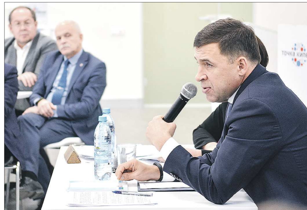
На вопросы предпринимателей глава региона дал обстоятельные ответы

Заседание экспертного совета при Уполномоченном по защите прав предпринимателей в Свердловской области прошло вчера в Екатеринбурге.