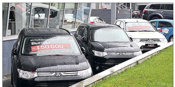
Автокредиты на Урале выдают под не менее чем 9% годовых