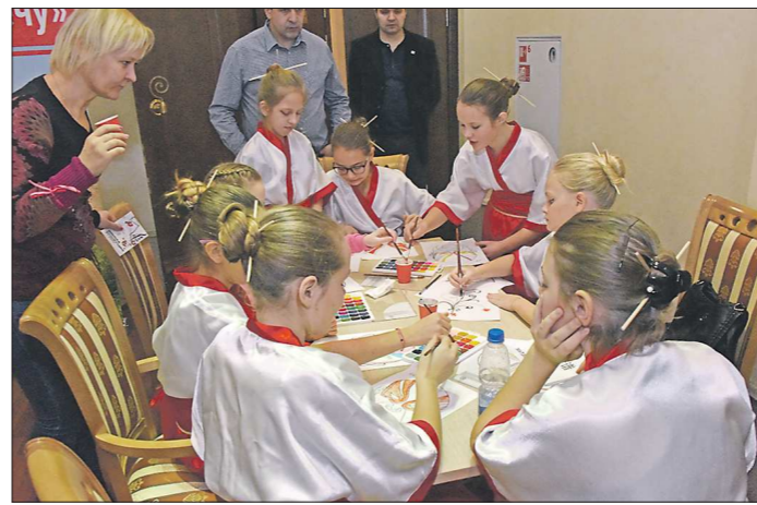
Преподаватели Школы Конфуция научили детей, как рисовать китайские оперные маски