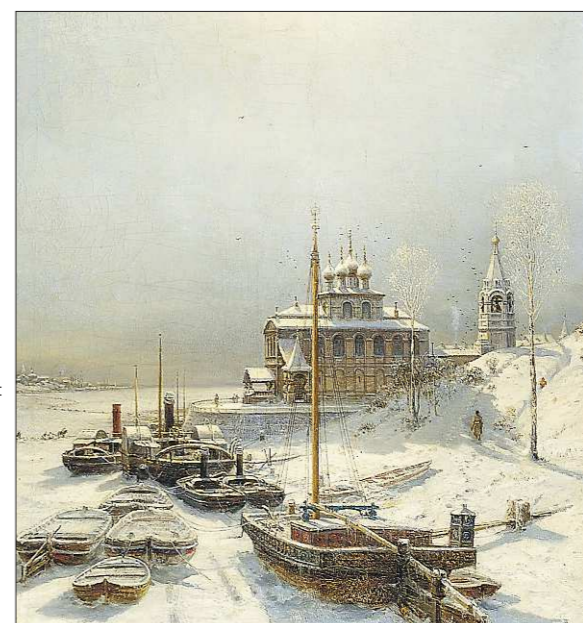
Алексей Боголюбов «Зима в Борисоглебске», 1881 год

Подготовлено в соответствии с критериями утверждёнными приказом Департамента информационной политики Свердловской области от 09.01.2018 №1 «Об утверждении критериев отнесения информационных материалов, публикуемых государственными учреждениями Свердловской области, в отношении которых функции и полномочия учредителя осуществляет Департамент информационной политики Свердловской области, к социально значимой информации».