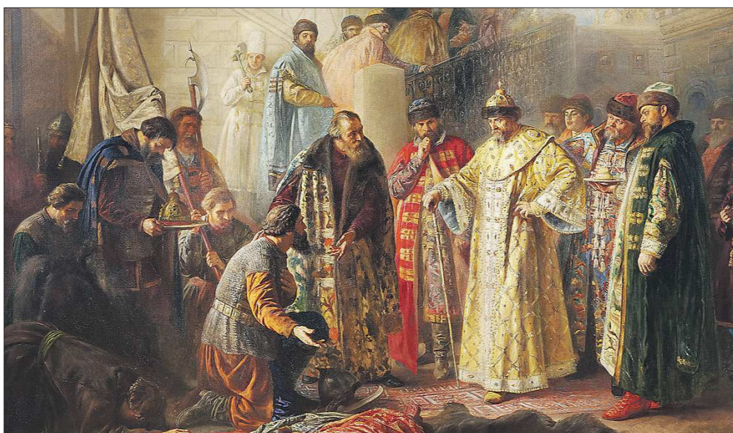
Картина Станислава Ростворовского «Послы Ермака у Красного крыльца перед Иваном Грозным», 1884 год

Подготовлено в соответствии с критериями утверждёнными приказом Департамента информационной политики Свердловской области от 09.01.2018 №1 «Об утверждении критериев отнесения информационных материалов, публикуемых государственными учреждениями Свердловской области, в отношении которых функции и полномочия учредителя осуществляет Департамент информационной политики Свердловской области, к социально значимой информации».