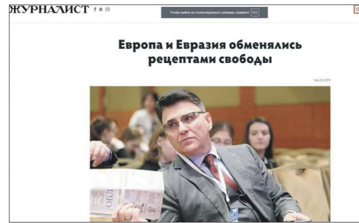
Материал «ОГ» попал во всероссийское издание

Подготовлено в соответствии с критериями, утверждёнными приказом Департамента информационной политики Свердловской области от 09.01.2018 №1 «Об утверждении критериев отнесения информационных материалов, публикуемых государственными учреждениями Свердловской области, в отношении которых функции и полномочия учредителя осуществляет Департамент информационной политики Свердловской области, к социально значимой информации».