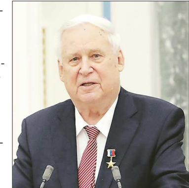
Звание Героя Труда России Николаю Рыжкову было присвоено Указом Президента РФ от 19 сентября 2019 года

В сентябре этого года Николаю Ивановичу исполнилось 90 лет. К юбилею именитого свердловчанина в «Областной газете» вышло с ним интервью. Разговор шёл о причинах краха экономических реформ на рубеже 80-90-х годов прошлого века, о серьёзной проблеме нынешнего дня, связанной с аномально высоким экономическим неравенством в России. Зашёл разговор и о национальной идее. Именно идея, а не идеология, как уточнил наш собеседник. - Только одна страна из 30 ведущих в мире не имеет национальной идеи - это мы. Как правило, она формулируется из трёх слов. Я для национальной идеи одно слово точно бы взял - «справедливость!» - сказал Николай Иванович.