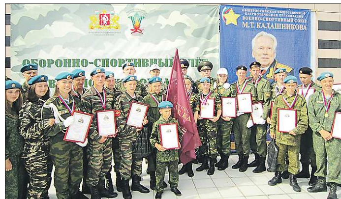
Призы областного оборонно-спортивного слёта, посвящённого 100-летию Михаила Калашникова

Указ «О праздновании 100-летия со дня рождения М.Т. Калашникова» Президент России Владимир Путин подписал ещё в октябре 2016 года, но отменил мы эту дату 10 ноября 2019 года.