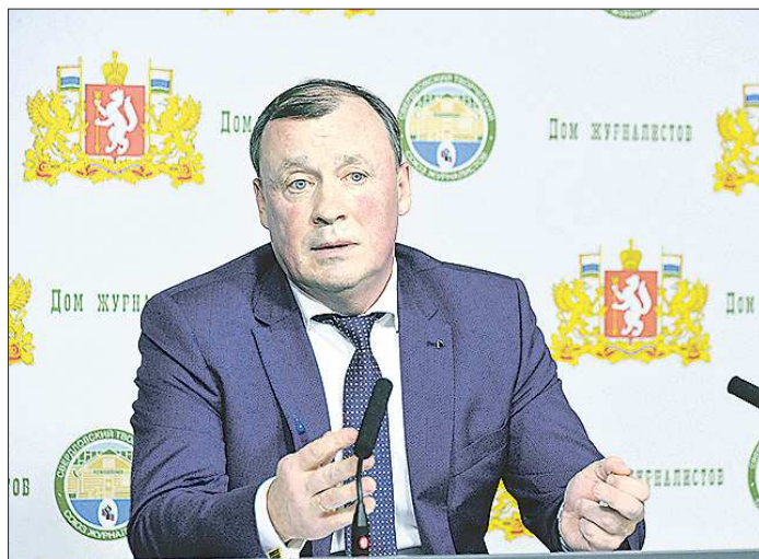
Первый заместитель губернатора Свердловской области Алексей Орлов отметил, что процедура обсуждения бюджета каждый год доказывает свою эффективность

Попытки вернуть вытрезвители в России в последние годы неоднократно обсуждались. В августе в Екатеринбурге в ходе публичных слушаний, прошедших в Екатеринбурге в августе этого года.