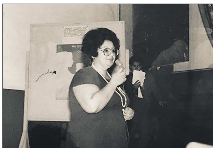
Учитель литературы, класный руководитель 6 «В» бакинской школы №228 впервые провела День матери 30 октября 1988 года