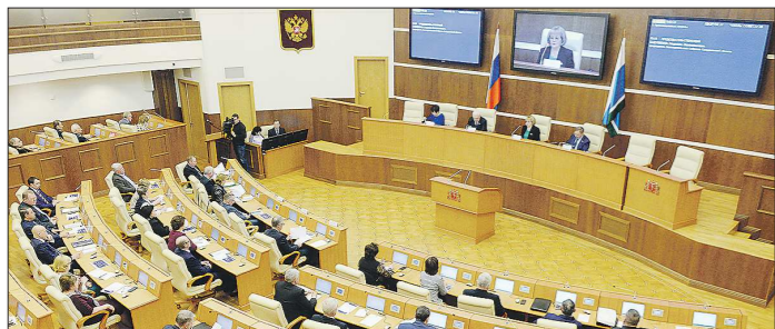
В числе приоритетов финансового документа – строительство объектов Универсиады и реализация нацпроектов