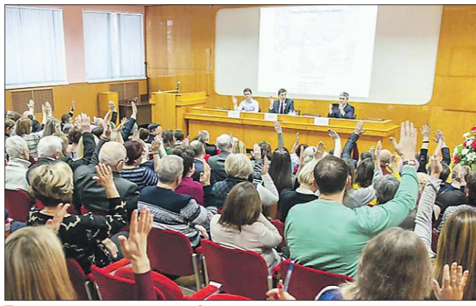
Тагильчане повторно одобрили проект строительства моста – большинством голосов

Мост через Тагильский пруд – один из самых крупных транспортных объектов Свердловской области на ближайшую пятилетку. Путепровод стоимостью 4 миллиарда рублей должен стать подарком Нижнему Тагилу к 300-летию. Известно, что проект уже прошёл государственную экспертизу, и средства на стройматериалы в размере 500 млн рублей зарезервированы в бюджете. Первый камень закладка тагильчане рассчитывали уложить на берегу пруда 11 августа – в День города. «Областел» выяснила, что же пошло не так, и каковы перспективы проекта.