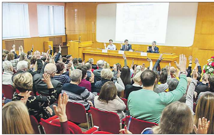
Тагильчане повторно одобрили проект строительства моста – большинством голосов

Мост через Тагильский пруд – один из самых крупных транспортных объектов Свердловской области на ближайшую пятилетку.