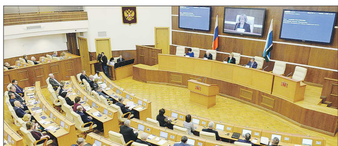
В числе приоритетов финансового документа – строительство объектов Универсиады и реализация нацпроектов