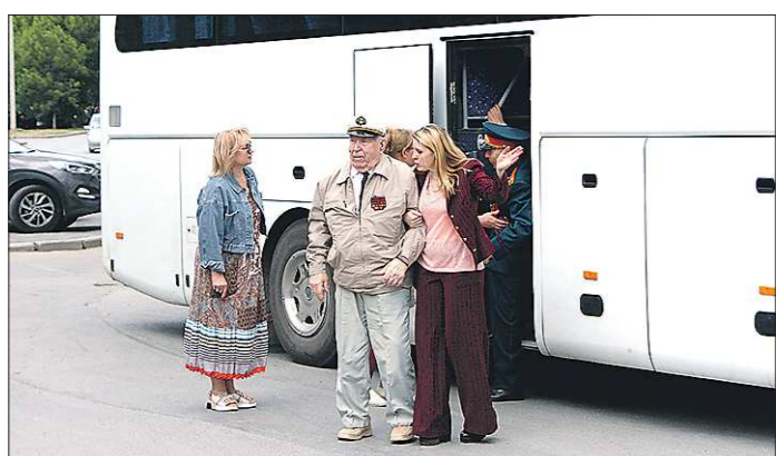
Сейчас в Свердловской области живёт около 2,5 тысячи ветеранов Великой Отечественной войны