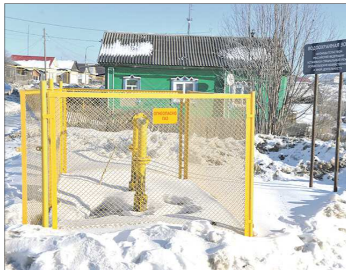
Иногда близость газовой трубы от дома не гарантирует лёгкую газификацию жилища

Этим летом, когда казалось, что всё готово и ничего не помешает протянуть газовую трубу в дом, выяснилось, что он стоит на... чужой земле. Не в прямом смысле, а согласно публичной кадастровой карте. Хозяйка дома даже не знала об этом, а газовики не предупредили о возможной проблеме, хотя в Троицком и Талице такая ситуация встречается сплошь и рядом. Эту ошибку пришлось спешно исправлять, вызывая кадастрового инженера – хлопоты потребовали времени.