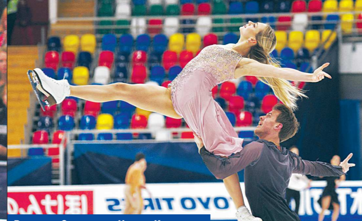
Виктория Синицина и Никита Кацалапов