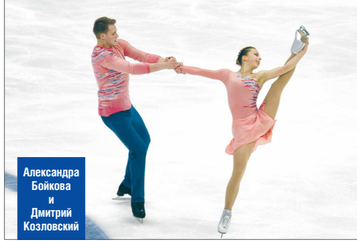
Александра Бойкова и Дмитрий Козловский

На трибунах за Александрой болели такие же юные подружки по команде – Анна Щербакова, Алёна Косторная. Щербакова, как и Трусова, уже обещала себе выход в финал Гран-при, Алёна – на пути к этому результату. Когда Сашу спросили, рада ли она, что девочки пришли её поддержать, она честно призналась: «У нас в Хрустальном просто сегодня выходной».