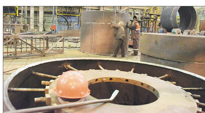
Сотрудников производственных подразделений изменения не коснутся

– Производственные подразделения продолжат работать в режиме полной рабочей недели, как и работники инженерных служб, задействованные в подготовке производства, – конструкторы, технологи, работники службы качества. Данная мера не скажется на заказах, которые сейчас находятся в производстве – все они будут выполнены в контрактные сроки с надлежащим качеством, – уточнили в пресс-службе предприятия.