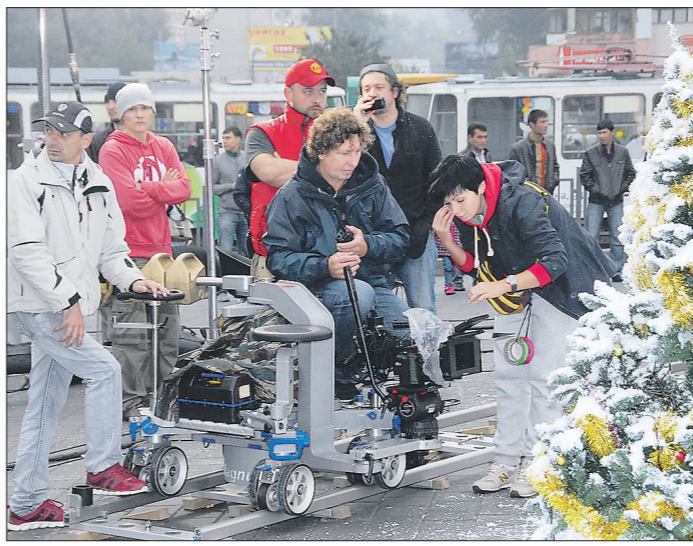
Финансовые гарантии помогут привлечь к международным проектам профессионалов из России

шу идею на входе поддержал Дмитрий Анатольевич Медведев , – приводит слова министра культуры РФ Владимира Мединского официального сайта ведомства. – За последние несколько месяцев разработали и в деталях согласовали с индустрией, со всеми заинтересованными сторонами текст и систему возмещения затрат иностранным кинопроизводителям, которые будут снимать кино в России. Планируется возмещать до 30 процентов, а в исключительных случаях и до 40 процентов расходов на транспорт, визы, наём российских работников, аренду съёмочных павильонов и так далее. Эта сумма возмещения больше, чем в ряде восточноевропейских стран, и мы надеемся, что наше предложение будет конкурентоспособным, сделает съемки для иностранцев в России более выгодными.