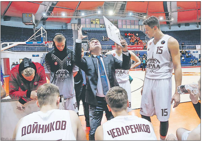
Баскетбольные бои в этот вечер были явными на стороне «Урала»

Подготовлено в соответствии с критериями, утвержденными приказом Департамента информационной политики Свердловской области от 09.01.2018 №1 «Об утверждении критериев отнесения информационных материалов, публикуемых государственными учреждениями Свердловской области, в отношении которых функции и полномочия учредителя осуществляет Департамент информационной политики Свердловской области, к социально значимой информации».