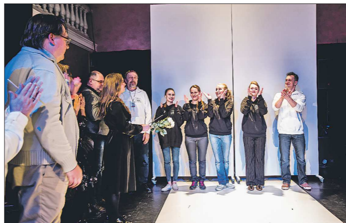
Часть сценографии спектакля «В Москву – разгонять тоску» стал длинный белый подиум

– В этом году фестиваль был не такой роскошный, как в прошлом, – отметил Николай Коляда. – Тогда приехало 650