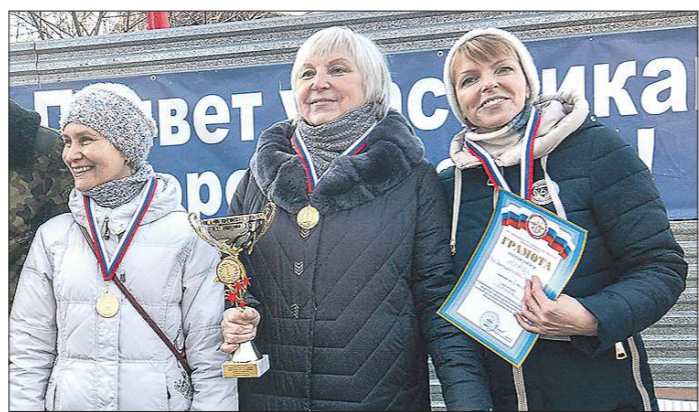
Девушки оказались отличными стрелками: первое место в командном зачёте заняла женская команда газеты «Знамя Победы»