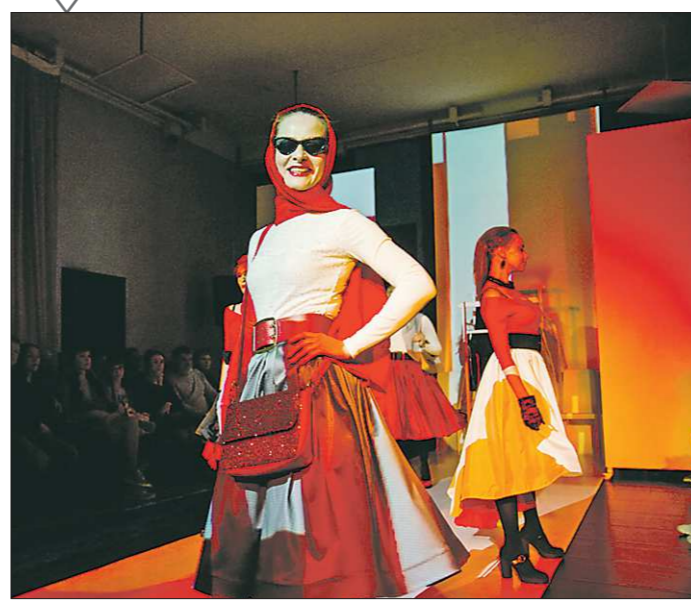
В Екатеринбурге подвели итоги XIII фестиваля «Коляда-Plays». Обладателем Гран-при стал Челябинский Молодёжный театр со спектаклем «В Москву - разгонять тоску». Частью сценарии этого спектакля стал длинный белый подиум