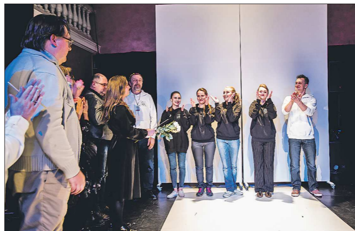
Часть сценария спектакля «В Москву – разгонять тоску» стал длинный белый подиум