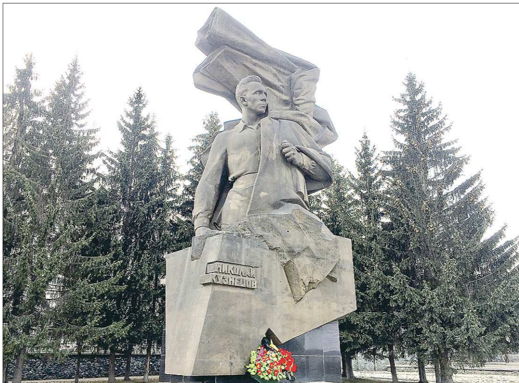
Памятник Николаю Кузнецову, установленный на улице Фестивальной в Орджоникидзевском районе Екатеринбурга

но и в США и Великобритании. Несмотря на это, лжеисследователи ставят под сомнение заслугу разведчика в раскрытии этого заговора. Музей разведчика Статья о Николае Кузнецове была опубликована накануне 75-летия со дня присвоения ему звания Героя Советского Союза. Это совпадение? — Ни в коем случае. Я очень удивлён, что такая знаменательная дата прошла незамеченно для Свердловской области: в школах не было ни одного урока или встречи к этой теме. Зато догадались напомнить о себе те, кто против героизации Великой Отечественной войны и подвигов русского народа.