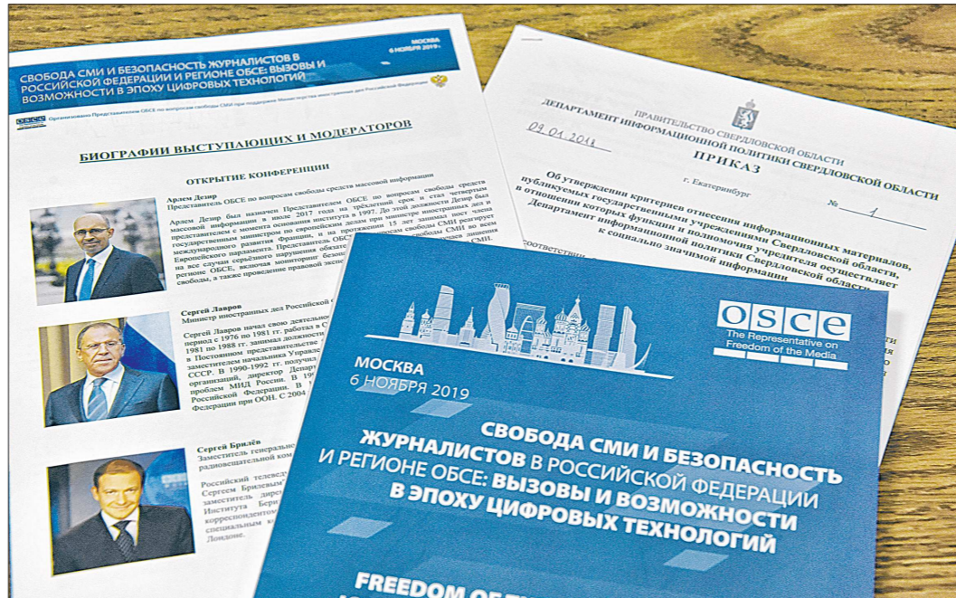
Международные нормы и российское законодательство исходят из того, что все материалы средств массовой информации являются социально значимыми, и чиновники не вправе вмешиваться в деятельность редакций.