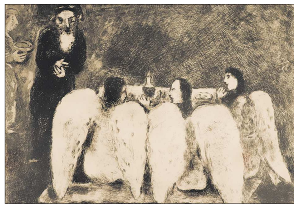
К иллюстрированию Ветхого Завета Марк Шагал приступил в 1931 году. Тогда же он получил приглашение от первого мэра Тель-Авива посетить Землю обетованную