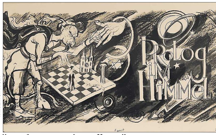
Над изображениями к «Фаусту» Максим Кантор трудился два года