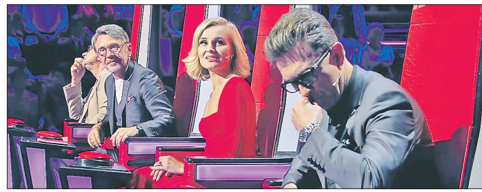
Нынешний состав членов жюри вызывает вопросы у многих зрителей «Голоса»

На мой взгляд, проблема заключается в том, что в первых трёх сезонах наставники представляли разные направления музыки. Градский отвечал за классическую музыку, Билан — за поп-исполнителей, Пелагея — за народное творчество и рок-музыку, Агутин — за джаз, регги, кантри. И все наставники дополняли друг друга, они работали как один механизм. За этим было интересно наблюдать. Приятно было послушать мнение профессионалов, которые объясняли конкурсантам, почему не раз-