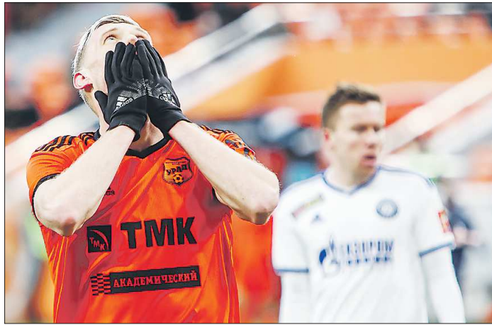
Уже завтра «Урал» начнёт второй круг чемпионата России, в Грозном «шмели» сыграют с «Ахматом»