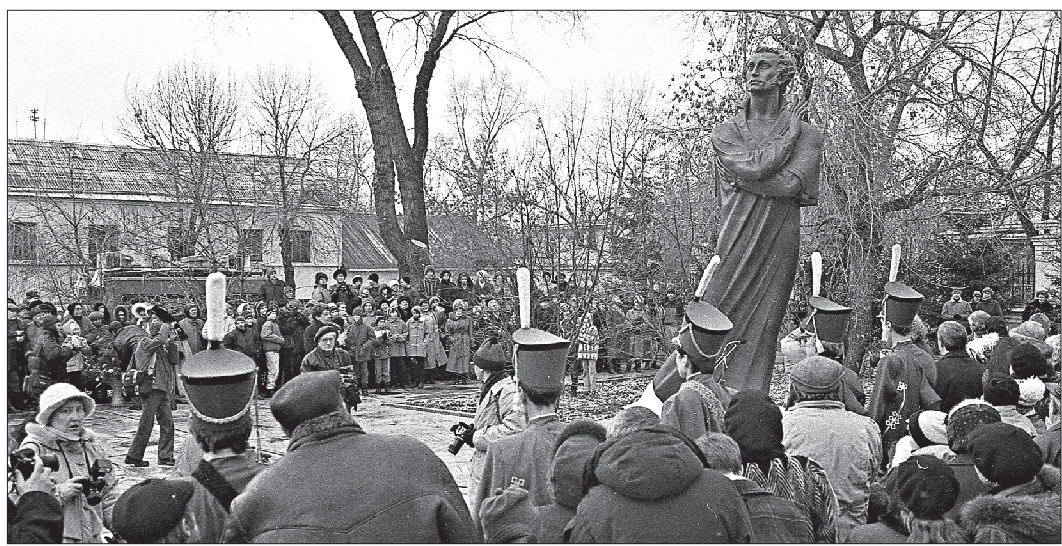
Под звуки марша Свиридова памятник на Урале был открыт в год 200-летия Поэта. Вчера в Москве под патронажем Президента РФ были обсуждены общероссийские мероприятия празднования 220-летия Пушкина

– Пушкин в Москве – философ, мыслитель, государственный. В Питере – поэт, читающий свои стихи. Изваяния