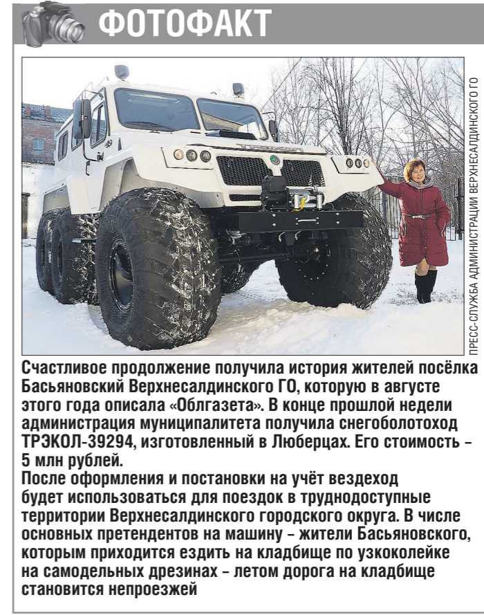
Счастливого продолжение получила история жителей посёлка Басьяновский Верхнесалдинского ГО, которую в августе этого года описала «Областная». В конце прошлой недели администрация муниципалитета получила снегопогрузчик ТРЭКОЛ-39294, изготовленный в Люберцах. Его стоимость – 5 млн рублей. После оформления и постановки на учёт внедорожник будет использоваться для поездок в труднодоступные территории Верхнесалдинского городского округа. В числе основных претендентов на машину – жители Басьяновского, которым приходится ездить на кладбище по узкоколейке на самодельных дрезинах – летом дорога на кладбище становится непроезжей