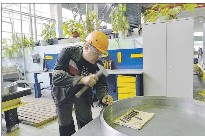
Обучение новой специальности для многих людей предпенсионного возраста – шанс остаться востребованным на родном предприятии

– Оказалось, что есть большая потребность в таких курсах со стороны населения, – рассказывает заместитель дирек-