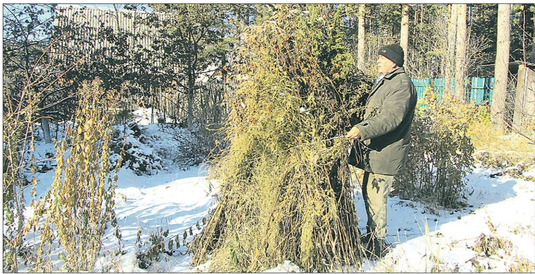
Время укрытия лапником зависит от размера растения и обычно занимает минут десять-двадцать