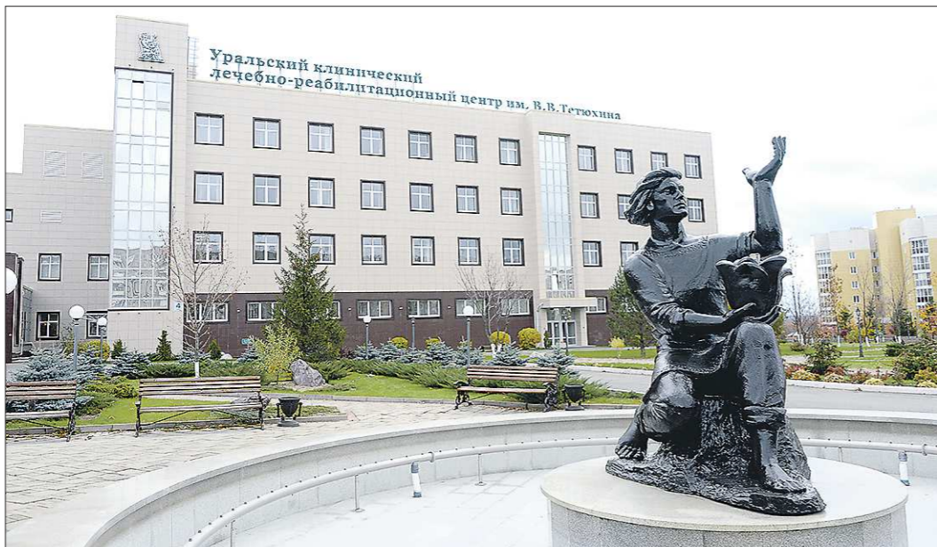
Центр задумывался как один из уральских брендов

По данным Минздрава РФ от 2012 года, норматив по этим операциям составляет две операции на тысячу человек в год. Всего по стране требуется проводить примерно 280–320 тысяч операций в год. Когда мы записались, в РФ выполнялось не больше 60 тысяч операций в год. На тот момент в листе ожидания в Свердловской области стояли более шести тысяч человек, время ожидания составляло до четырёх лет. С тех пор, в том числе благодаря результатам работы центра, очередь сведена к минимуму. – Такого комплекса нет не только ни в одной отечественной клинике, но и не все европейские клиники могли бы похвастаться таким оснащением.