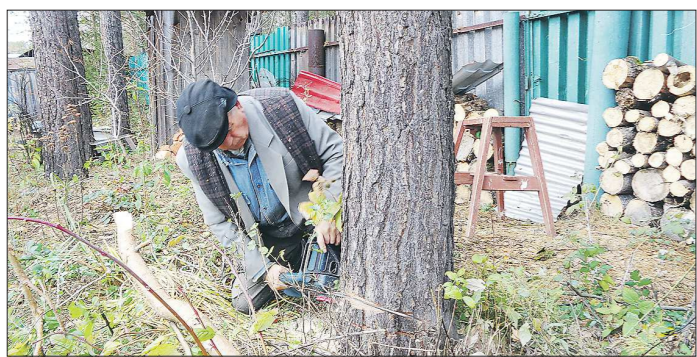
Главное при спиливании деревьев – соблюдать технику безопасности