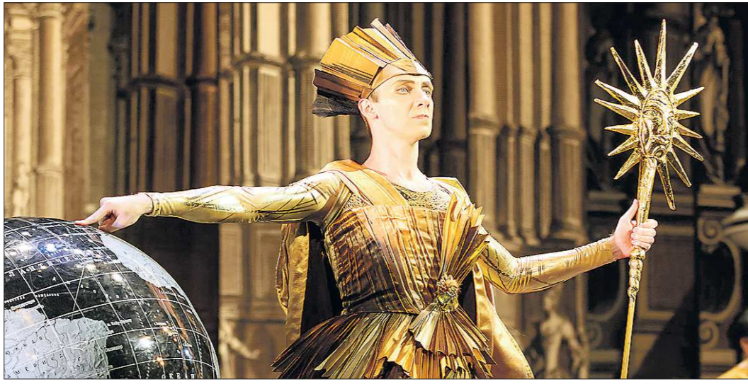
В скором времени спектакль «Приказ короля» увидят не получится – ближайший показ запланирован на февраль будущего года, весной артисты ждёт конкурсный показ в столице. Победителей «Маски» назовут 15 апреля в концертном зале «Зарядье»

И это ещё не все рекорды – «Урал Опера Балет» получил самое большое количество номинаций среди всех музыкальных театров страны, и это тоже прорыв. Конечно, нельзя не сказать, что этому предшествовало одно важное обстоятельство, а именно отъезд из Перми мастера Теодора Курентзиса, ведь несколько лет пальма первенства на «Маске» оставалась именно за Пермским театром оперы и балета. Этот кол-