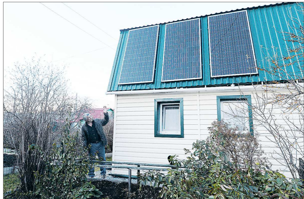
Олег Ермолаев потратил на солнечные панели и аккумуляторы к ним порядка 100 тысяч рублей, но эти деньги окупились в течение нескольких лет. Теперь электричество он получает бесплатно

Принцип работы солнечной станции прост: фотоэлементы переводят свет в электричество, оно накапливается в аккумуляторах, преобразуется из постоянного тока в переменный и питает электроприборы с напряжением 220 вольт. Всем процессом в автоматическом режиме управляет специальный контроллер. По сути, это система «умного дома», которая