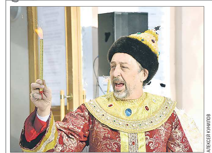
Вчера на площади перед «Колыда-театром» состоялось открытие XIII фестиваля «Колыда-Плеяда». За десять дней театрального не-стопга гости увидят 36 спектаклей на семи площадках города, поставленных по пьесам уральских драматургов. В этом году участниками фестиваля стали труппы из России, Казахстана и Финляндии. Фоторепортаж с открытия – на oblgazeta.ru