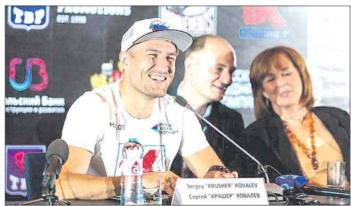
Сергей Ковалёв получит за бой с Альваресом самый большой гонорар в карьере