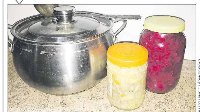
Такой домашний суп можно закрывать и металлическими, и пластиковыми крышками