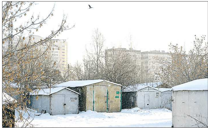
Собственники гаражей и машино-мест теперь тоже смогут претендовать на налоговые льготы